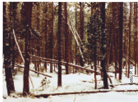
Abbildung 3: Stabelchod im Nationalpark: Nassschnee hat einzelne Bergföhren umgedrückt.

Zahlreiche weitere Beispiele von Störungen liessen sich anfügen (vgl. Beitrag von Britta Allgöwer auf Seite 8/9 in diesem Heft). Störungen prägen die Wälder stark, auch den Wald im Nationalpark. Hier sind vielfältige Regenerationsphasen nach Ereignissen wie Feuer, Windwurf, Lawinen und Murgang zu beobachten. €