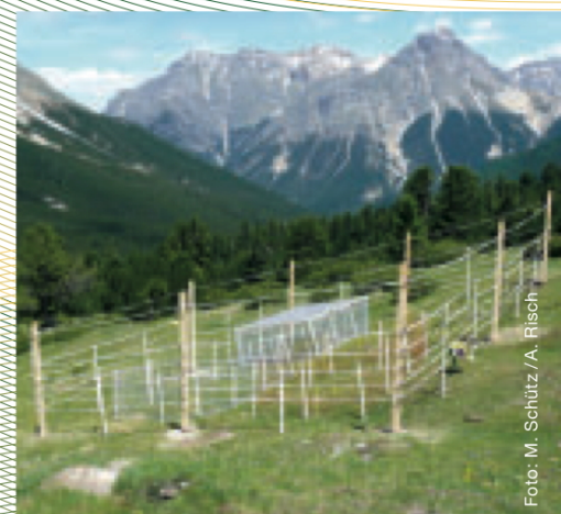
Abbildung 2: Zaun auf Alp Mingèr aufgestellt im Juni 2009

Über diesen oder andere Stoffflüsse sind Lebewesen in Beziehungsnetzen miteinander verbunden. Verändert sich ein einzelner Faktor eines Netzes, können sich grundsätzlich alle anderen Faktoren auch verändern. Für die Weiden im Nationalpark stellen sich eine Reihe von Fragen: Was würde beispielsweise passieren, wenn die grossen pflanzenfressenden Huftiere wegfallen? Würden die Pflanzen mehr Sprosse und Wurzeln bilden? Würden andere pflanzenfressende Tiergruppen wie Feldmäuse profitieren, weil das Nahrungsangebot grösser und der Sichtschutz gegen Raubtiere verbessert würden? Oder würde sich die Zusammensetzung der Vegetation negativ verändern, indem nährstoffreiche Kräuter durch faserreiche Seggen verdrängt würden, das Nahrungsangebot für Feldmäuse folglich schlechter und die Bestände kleiner würden? Was passiert mit den abbauenden Bodenorganismen, wenn viel weniger Kot von pflanzenfressenden Tieren, dafür viel mehr faserreiches Pflanzenmaterial zur Verfügung stünde? Würde sich der ganze Stoffumsatz verlangsamen, würden folglich für das Pflanzenwachstum weniger Nährstoffe zur Verfügung stehen? Würde das bedeuten, dass langfristig nicht mehr, sondern weniger Sprosse und