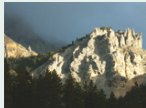
Bergföhrenwald und Felsformation im Gebiet Il Fuorn

Im Nationalpark kommen alle Singvogelarten vor, die man aufgrund der Lage und der Topografie erwarten dürfte. Ein Grund dafür ist, dass der Wald trotz seinem jugendlichen Alter von 150 Jahren sehr strukturiert und reich an Totholz ist. Dank Erdbeben, Lawinen, Schneedruck und den harten klimatischen Bedingungen kommen von der Verjüngungsphase bis zur Optimalphase, von der Zerfallsphase bis zum völligen Zusammenbruch, alle Sukzessionsphasen vor, und dies begünstigt die Artenvielfalt und ihre Stabilität. Die prognostizierte Klimaerwärmung hat hier allenfalls Arealverschiebungen einzelner Arten zur Folge (zum Beispiel Amsel, Ringdrossel), Singvogelarten werden jedoch auch längerfristig hier nicht aus diesen Gründen verschwinden. Viel eher könnten einige Laubwaldarten in den unteren Lagen etwas häufiger oder regelmässiger im Park brüten, wie die Schwanzmeise oder der Grünfink. Grosse Bestandsschwankungen in Abhängigkeit von der Ausaperung sind in diesen