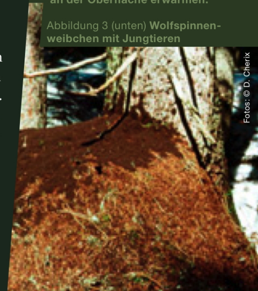
Abbildung 3 (unten) Wolfsspinnenweibchen mit Jungtieren

Abbildung 1 (oben) Ameisenhaufen der Waldameisen während der Frühlingssonnung: Unzählige Arbeiterinnen lassen sich an der Oberfläche erwärmen.