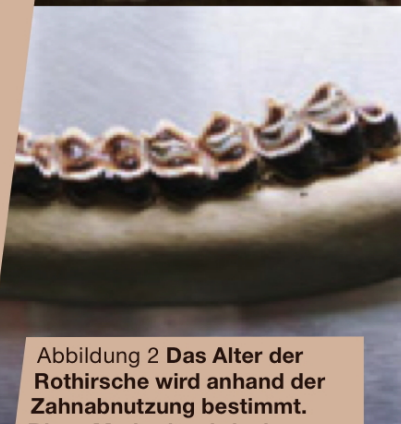
Abbildung 2 Das Alter der Rothirsche wird anhand der Zahnabnutzung bestimmt. Diese Methode wird mit markierten Tieren bekannten Alters sowie mittels Ersatzdentinanschliffen regelmässig überprüft und geeicht.