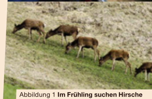
Abbildung 1 Im Frühling suchen Hirsche bei Tag und noch bevorzugter bei Nacht die frisch ergrünenden Wiesen zur Nahrungssuche auf. Mit Scheinwerfern können sie dann gezählt werden.

Hannes Jenny Amt für Jagd und Fischerei Graubünden Loëstrasse 14, 7001 Chur