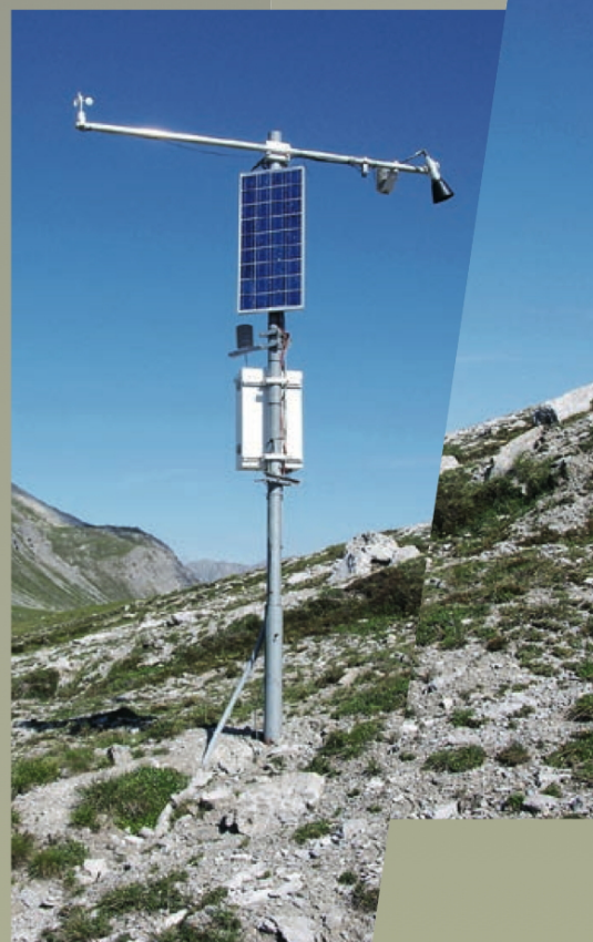
Abb. 2 Klimastation am Munt Chavagl

Armin Rist, Geographisches Institut Universität Bern, Hallerstrasse 12, 3012 Bern