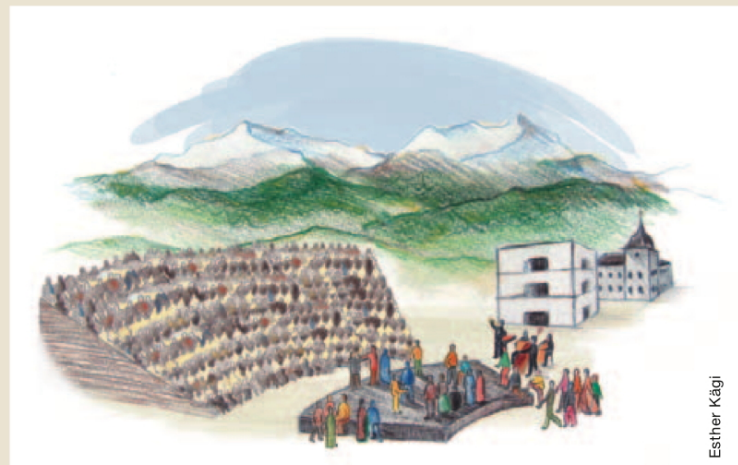
Freilichtspiel in Zernez

Form gefeiert werden soll. Zu diesem Zweck wurde ein Organisationskomitee eingesetzt, das sich bereits intensiv mit der Planung und Umsetzung der Aktivitäten im Jubiläumsjahr befasst. Unterstützt wird es dabei von einem Patronatskomitee unter Federführung von Bundesrätin Doris Leuthard, das für die breite Abstützung des Projekts sorgt.