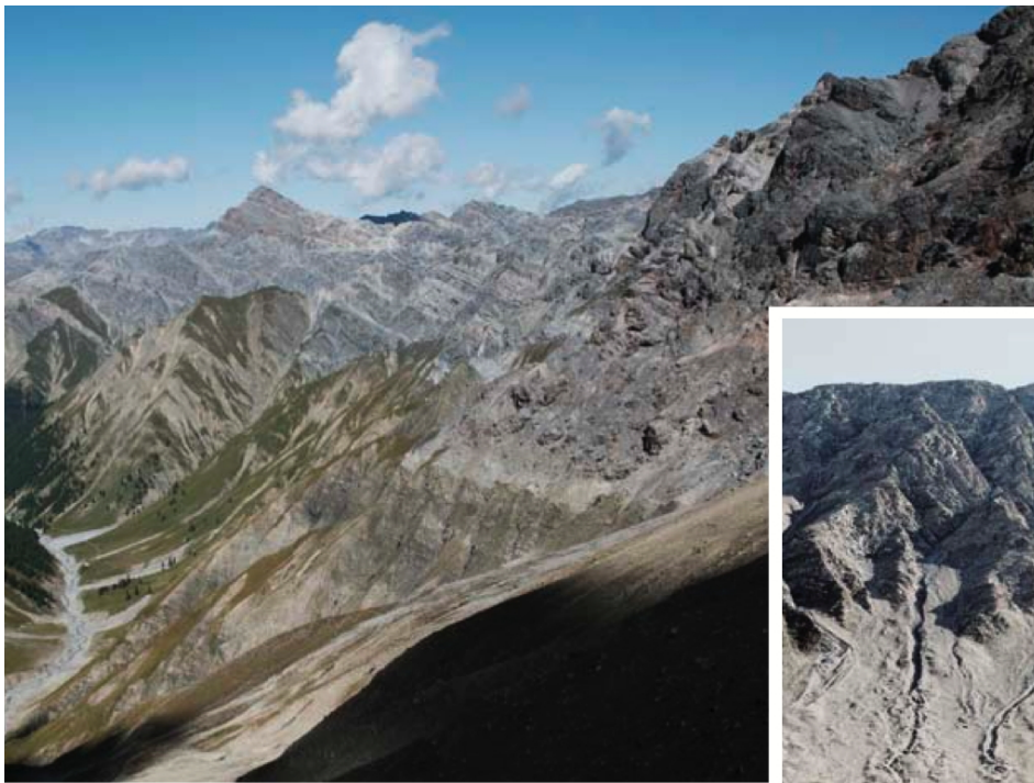
Blick von der Fuorcla in die Val Trupchun. Rechts ist deutlich die Grenze zwischen den vegetationsbedeckten Gesteinen der Ortlerdecke und dem kargen Dolomit der Quattervalsdecke zu sehen. Der ältere Dolomit wurde bei der Alpenfaltung auf die jüngeren Kalkschiefer geschoben.