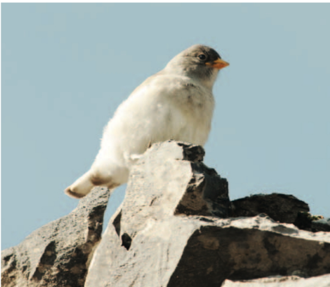
Auch Schneefinken Montifringilla nivalis sind hart im Nehmen. Sie besiedeln im Sommer die höchsten Lagen des Nationalparks.

Doch es ist ein Spiel mit dem Feuer, denn die Lawinen können sowohl Segen als auch Fluch sein. So haben Parkwächter im Winter 1999 hier mehrere Dutzend tote Steinböcke gefunden. Die meisten von ihnen kamen in Lawinen um. In einem einzigen Winter ging ein Drittel des Bestandes im Nationalpark zugrunde. Auch das ist Natur.