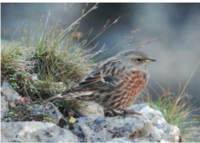
Ein Spezialist dieser kargen Gebirgslandschaft: Die Alpenbraunelle Prunella collaris mit ihrem kräftigen Körperbau übersteht auch garstige Witterungsverhältnisse.