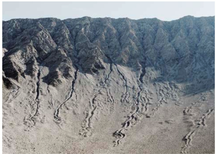
Erosion live: Murgangrinnen durchziehen den steilen Kessel des Piz Chaschauna.

Seite die vielzitierte Val Trupchun, Hirscharena der Alpen und Favoritin mancher Nationalparkwanderer. Die Wanderung verbindet die beiden Welten vortrefflich – ein Erlebnis der Extraklasse. Was nicht heisst, dass die Wanderer hier oben immer freundlich empfangen werden. Die karge Vegetation lässt erahnen, dass auf fast 2800 m ü.M. nicht stets gastfreundliche Witterung herrscht. Der Wind kann auf dem nach Norden offenen Sattel durchaus Orkanstärke erreichen, weshalb man die Tour nur bei sicheren Verhältnissen in Angriff nehmen sollte.