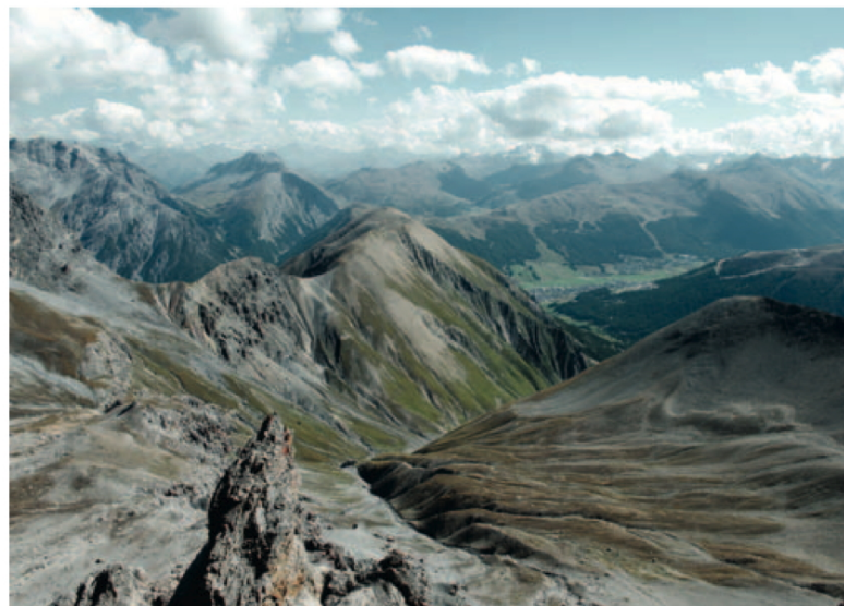
Blick in die italienische Valle del Saliente. In der Mitte Il Motto, im Talgrund die Ortschaft Livigno

des Piz Chaschauna oder an schattigen Stellen – meist liegend und mit Wiederkäuen beschäftigt.