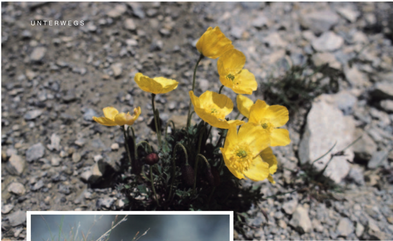
Der Rätische Alpenmohn Papaver rhaeticum lässt sich durch das raue Klima nicht aus der Ruhe bringen. Die zierliche Pflanze überlebt selbst Stürme meist unbeschadet.