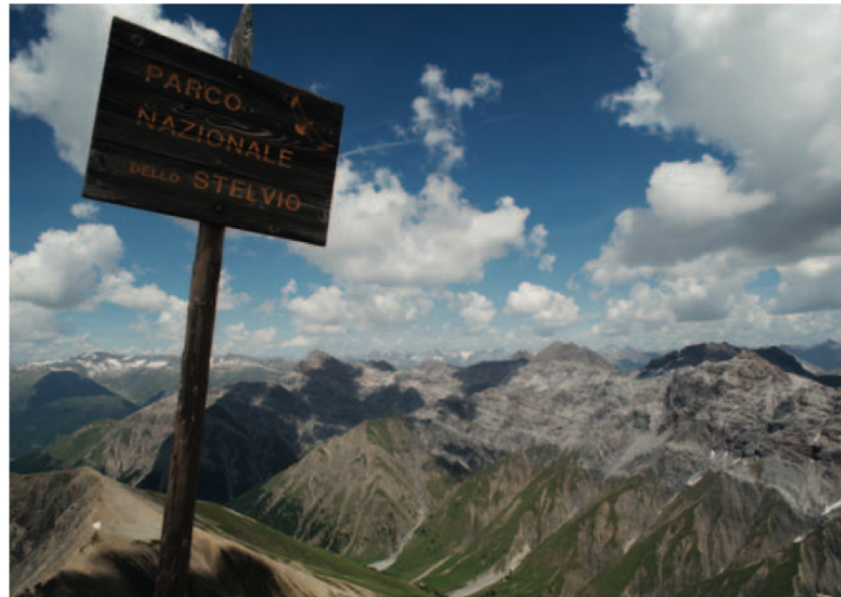
Die Landesgrenze ist zugleich auch die Grenze zwischen dem Schweizerischen Nationalpark und dem italienischen Parco Nazionale dello Stelvio. Im Vordergrund die Val Trupchun

Dieses Gebiet ist bekannt für seinen Reichtum an Steinböcken. Im Winter finden die Hornträger am östlich gelegenen Il Motto ideale Lebensräume. In der warmen Jahreszeit suchen die Tiere die höheren Lagen auf, um sich im Kretenwind die notwendige Abkühlung zu verschaffen. Steinböcke sind auf Aussentemperaturen von -20 bis +10 °C eingestellt, +20 °C sind bereits ein Stressfaktor. Deshalb sehen wir die Steinböcke an heissen Hochsommertagen häufig auf dem zugigen Grat