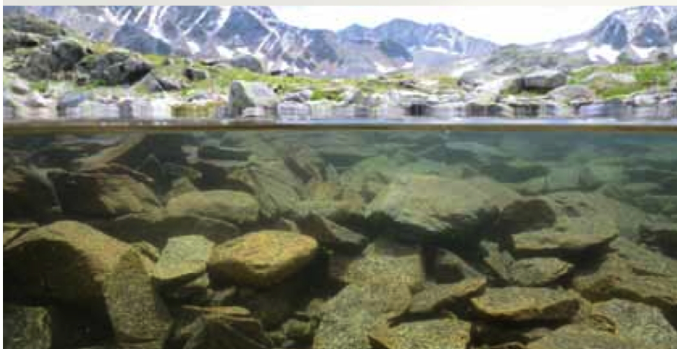
Abb. 3 Die Fische in den Macunseen haben die Welt unter und über Wasser im Blickfeld. Nahrung bieten sowohl die mit Zuckmückenköchern dicht besiedelten Blocksteine als auch die Wasseroberfläche, auf der an sonnigen Sommertagen Tausende von Insekten landen.

Fische konnten von dort aber nicht auf natürlichem Wege in Hochalpenseen gelangen; hier hat der Mensch nachgeholfen. Der Wunsch, Naturerlebnis mit Angelfischerei zu verbinden, hat sich in den letzten 50 Jahren deutlich verstärkt. Seit ca. 1970 wurde auch in Graubünden der Fischbesatz in Alpengseen stark intensiviert. Dafür wurden auch mehrere Seen in über 2500 m Höhe genutzt, darunter auch einige der Macunseen.