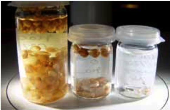
Abb. 2 Ein Ergebnis der Nahrungsanalysen: Im Lai Grond hatten einzelne Bachforellen mehr als 50 Erbsenmuscheln in ihrem Magen. Hierzu mussten sie – ungewöhnlich für Forellen – unter anderem im Seegrund graben. Einige Forellen im Lai Sura hatten dagegen nur Landkäfer gefressen.

man kleinere Artgenossen nicht verschmäht. Macunfische fressen in den verschiedenen Seen immer die dort gerade häufigste und am besten verfügbare Nahrung. Sie haben zum Beispiel gelernt, am Seegrund Erbsenmuscheln auszugraben und die Köcher von Zuckmückenlarven von Steinen abzupicken (Abbildungen 2 und 3). In den wärmeren Sommermonaten gehen sie sofort auf alle Kleinlebewesen los, die sich unter Wasser bewegen, und auch auf solche, die im Sommerhalbjahr auf die Wasseroberfläche fallen.