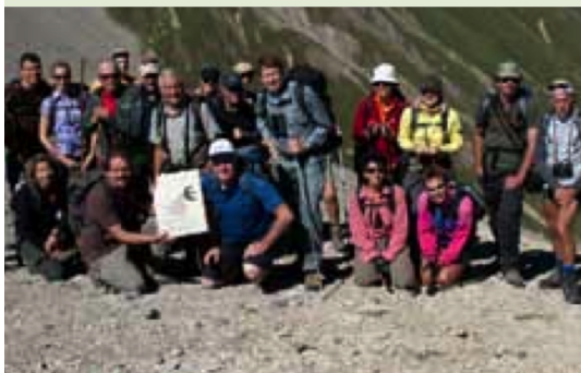
S-chanferinnen und S-chanfer auf der Fuorcla Trupchun.

Sie thematisierten die Resultate der Besucherbefragungen und Besucherzählungen, neue digitale Verfahren zur Geländeerfassung und aktuelle Erkenntnisse zur Huftierforschung. Auf der Alp Trupchun wurden die Gäste mit einer Marena verwöhnt und die beiden Gruppen hatten Gelegenheit, ihre Erlebnisse auszutauschen. (lo)