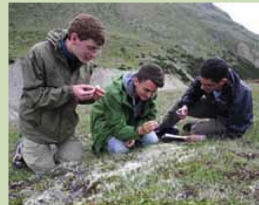
Jugendliche beim Pflanzenbestimmen

Worauf haben es fleischfressende Pflanzen abgesehen? Wodurch lassen sich Murmeltiere aus der Ruhe bringen? Und was machen eigentlich Gämsen den ganzen Tag? Um diese Fragen zu beantworten, sind Ende Juni 24 Jugendliche aus der ganzen Schweiz und aus 10 europäischen Ländern in die Val Mora gereist. Die Forschungsprojekte fanden im Rahmen der International Wildlife Research Week statt, einer Studienwoche, die jährlich von der Stiftung «Schweizer Jugend forscht» organisiert und durchgeführt wird. Die Jugendlichen hatten die Möglichkeit, während einer Woche auf eine eigene Frage zu Fauna oder Flora Antworten zu suchen. Am Ende der Woche konnten die Teilnehmenden ihre Ergebnisse in Zuoz der interessierten Öffentlichkeit präsentieren. Bereits zum dritten Mal fand diese Studienwoche in der Biosfera Val Müstair statt. (Beat Schlüchter)