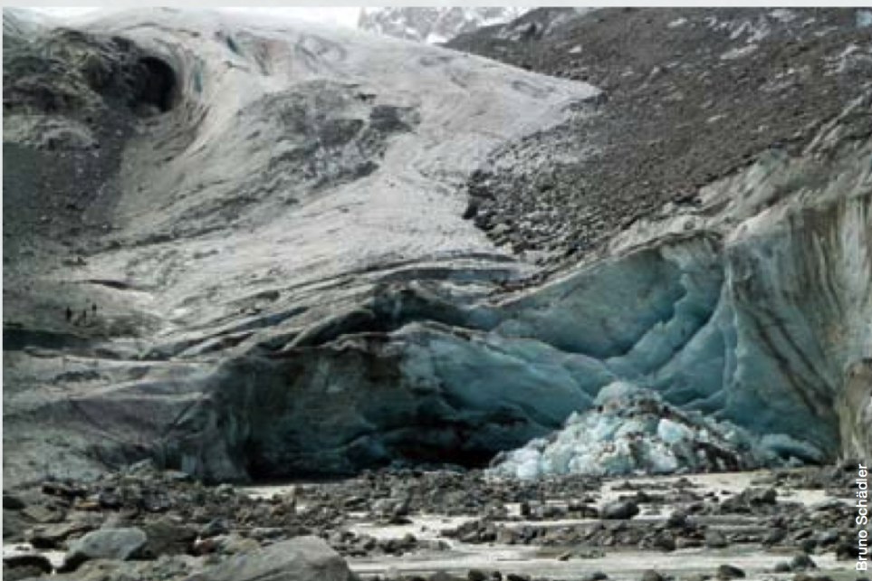
Abb. 1 An der Zunge des Morteratschgletschers ist das Abschmelzen besonders gut sichtbar.

Der durch den Menschen verstärkte Treibhauseffekt hat zur Folge, dass der Atmosphäre mehr Energie zur Verfügung steht und dass damit auch mehr Wasserdampf aus den Ozeanen aufgenommen werden kann: Die Wahrscheinlichkeit steigt, dass es bei uns mehr regnen wird. Neue Forschungsergebnisse der ETH und von MeteoSchweiz zeigen, dass – unter der Annahme eines mittleren Emissionsszenarios – im Einzugsgebiet der Ova dal Fuorn bis Punt la Drossa (Fläche 55,3 km 2 ), bedingt durch die Lage am Südkamm der Alpen, die jährlichen Niederschlagsmengen mit insgesamt gut 1000 mm praktisch unverändert bleiben werden. Allerdings verändert sich die jahreszeitliche Verteilung: Im Sommer gibt es etwas weniger, in den übrigen Jahreszeiten etwas mehr Niederschlag. Durch die erwartete Erwärmung von 3 bis 4 Grad bis zum Jahr 2100 nimmt auch über den Landoberflächen die Verdunstung zu, im Engadin von 240 auf 290 mm pro Jahr (20%). Durch diese Zunahme vermindert sich natürlich die zur Verfügung stehende Wassermenge besonders im Sommer zusätzlich.