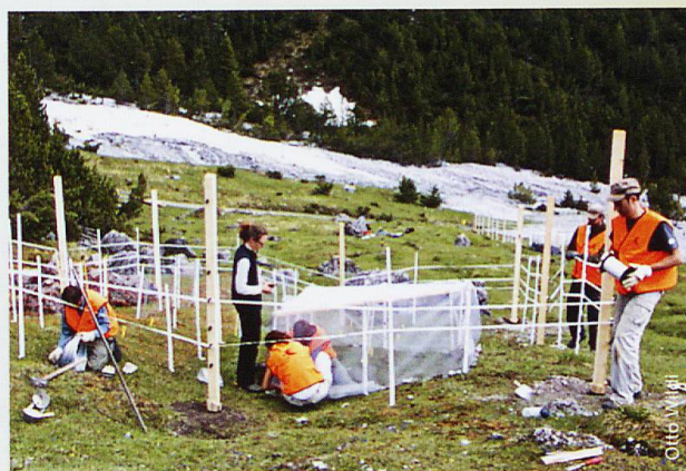
Otto Wildi Forschungsanstalt WSL, Birmensdorf

Die experimentell ausgerichtete Forschung der vergangenen Jahre hat viel zur Frage beigetragen, wie die Beziehungen zwischen Pflanzen und Tieren im Nationalpark ablaufen.