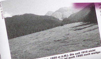
Abb. 1: Alp Stabelchod (ca. 1950 m ü.M.). Die seit 1918 nicht mehr landwirtschaftlich genutzte Alp ist auch 1995 noch weitgehend baumfrei.

Die vorgestellten Ergebnisse aus den Langzeitbeobachtungen auf Dauerflächen legen den Schluss nahe, dass die heutige Huftierdichte im Nationalpark nur dann als zu hoch einzustufen ist, wenn gewünscht wird, dass sich auf den waldfähigen Flächen innerhalb des Parks möglichst rasch ein geschlossener Wald entwickelt. Besteht das Ziel hingegen darin, in der subalpinen Stufe das heutige Verhältnis (nicht die geografische Verteilung) von Wald und Freiland zu erhalten oder die Entwicklung zu einer halboffenen Weidelandschaft zu fördern, dann hat es heute eher zu wenige als zu viele Gemsen und Hirsche im Park.