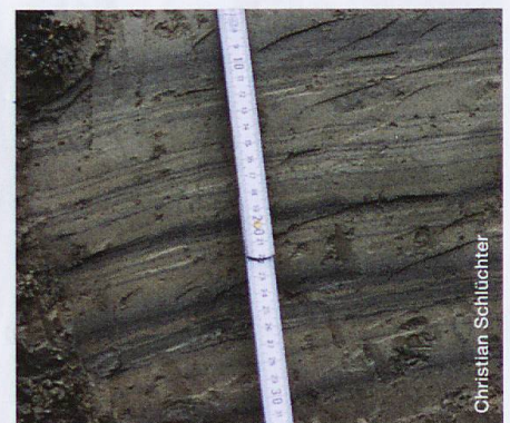
Abb. 2 Seeablagerungen (Ss) im Detail

Christian Schlüchter, Institut für Geologie der Universität Bern Franziska Nyffenegger, Geozentrum, Berner Fachhochschule, Burgdorf