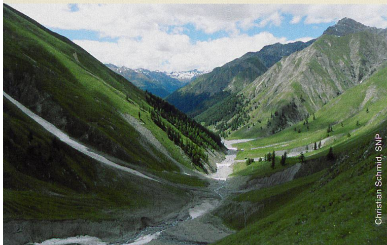
Christian Schmid, SNP

In einem Forschungsprojekt wurden nun erstmals die Hauptnahrungsgebiete der 3 Huftierarten untersucht. Dazu wurden Quantität (Biomasse) und Qualität