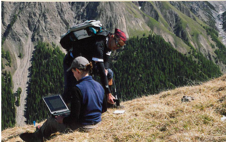
Abb. 5 Spektralmessungen in der Val Trupchun

Ob diese Ressourcenaufteilung auf Konkurrenz oder Koexistenz hinweist, lässt sich nicht eindeutig beantworten. Obwohl anzunehmen ist, dass Nahrungsnischen im Laufe der Evolution aus Konkurrenzsituationen entstanden sind, müsste man aktuelle Konkurrenz mittels Auswirkungen auf die Fitness der Arten nachweisen. Dies liesse sich testen, indem man eine Art nach der anderen aus einem Gebiet entfernt und die Populationsentwicklung und Nahrungsnischen der verbleibenden Arten, mit und ohne ihre potenziellen Konkurrenten, vergleicht. Solch ein Versuch ist freilich im Nationalpark nicht angedacht. Ausserdem können innerartliche Konkurrenz, räumlich und zeitlich verschiedene Raumnutzung oder Umwelteinflüsse, wie zum Beispiel strenge Winter, Konkurrenz reduzieren.