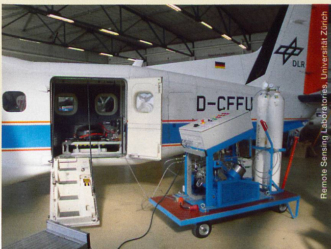
Abb. 2 Dornier DO-228 mit dem Bildspektrometer Apex

Aus den GPS-Daten besonderer Tiere lassen sich Verhaltensmuster ableiten und zum Beispiel die bevorzugten Nahrungsgebiete der einzelnen Arten feststellen. Überlagert man nun die hochaufgelösten Vegetationskarten mit den Hauptnahrungsgebieten der drei Arten (Abbildung 3), so zeigt sich, dass diese nicht nur unterschiedliche Orte als Hauptnahrungsgebiete nutzen, sondern auch, dass sich diese hinsichtlich der Quantität und Qualität der Vegetation deutlich unterscheiden.