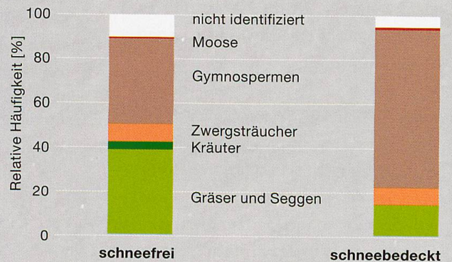
Abb. 1 Nahrungszusammensetzung des Schneehasen im Schweizerischen Nationalpark in der schneefreien und in der schneebedeckten Jahreszeit (modifiziert nach Rehnus et al. 2013)

Der Schneehase nutzt vorzugsweise strukturreiche Lebensräume des oberen Gebirgswaldes und der alpinen Stufe. Er bevorzugt Lebensräume mit Deckungsmöglichkeiten wie Legföhrenbestände oder mehrschichtig aufgebaute Waldbestände. Dort findet der Schneehase Schutz vor Fein-