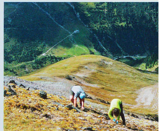
Abb. 3 Entnahme des Bodens für die Verpflanzung und Ausheben der Löcher für die Töpfe am Mot dal Gajer auf 2797 m ü. M. Weitere Experimente finden am Mot dal Hom (Nebengipfel, 2450 m ü. M.) und am Piz Plazer (3100 m ü. M.) statt.