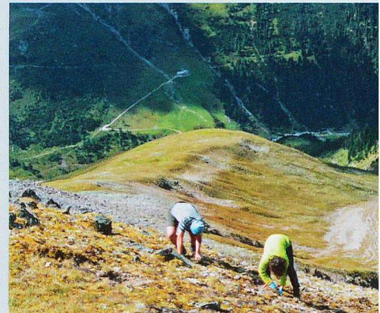
Abb. 3 Entnahme des Bodens für die Verpflanzung und Ausheben der Löcher für die Töpfe am Mot dal Gajer auf 2797 m ü. M. Weitere Experimente finden am Mot dal Hom (Nebengipfel, 2450 m ü. M.) und am Piz Plazer (3100 m ü. M.) statt.