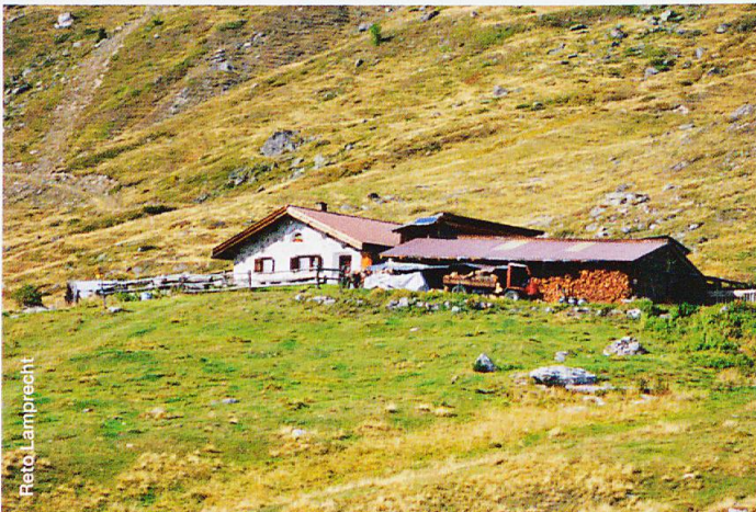
Abb. 3 Die Alpwirtschaft (hier Alp Tabladatsch) ist prägend für die Region. In der Pufferzone wird extensive Landwirtschaft und der Erhalt der Kulturlandschaft gefördert.

Das ausserordentliche Landschaftsbild der Val Müstair ist das Ergebnis landwirtschaftlicher Bewirtschaftung über Jahrhunderte. Abbildung 2 zeigt, wo Landwirtinnen und Landwirte ihre Aufgabe sehen. Neben der Produktion von hochwertigen Lebensmitteln, die durch Veredelung wie etwa zu Käse auch einen wichtigen Wirtschaftsfaktor in der Region darstellen, gehört zu den Aufgaben auch die Landschaftspflege und der Erhalt vielfältiger, kleinstrukturierter Habitats, die für eine einzigartige Biodiversität von grösster Bedeutung sind. Die Landwirtinnen und Landwirte selber sehen sich als Produzenten qualitativ hochwertiger Lebensmittel, und dort liegt auch ihre Motivation. Doch gerade im Berggebiet sind öffentliche Mittel ein essenzieller Teil des landwirtschaftlichen Einkommens, das sich oft aus unterschiedlichen, auch nicht-landwirtschaftlichen Quellen zusammensetzt (DARNHOFER et al. 2016).