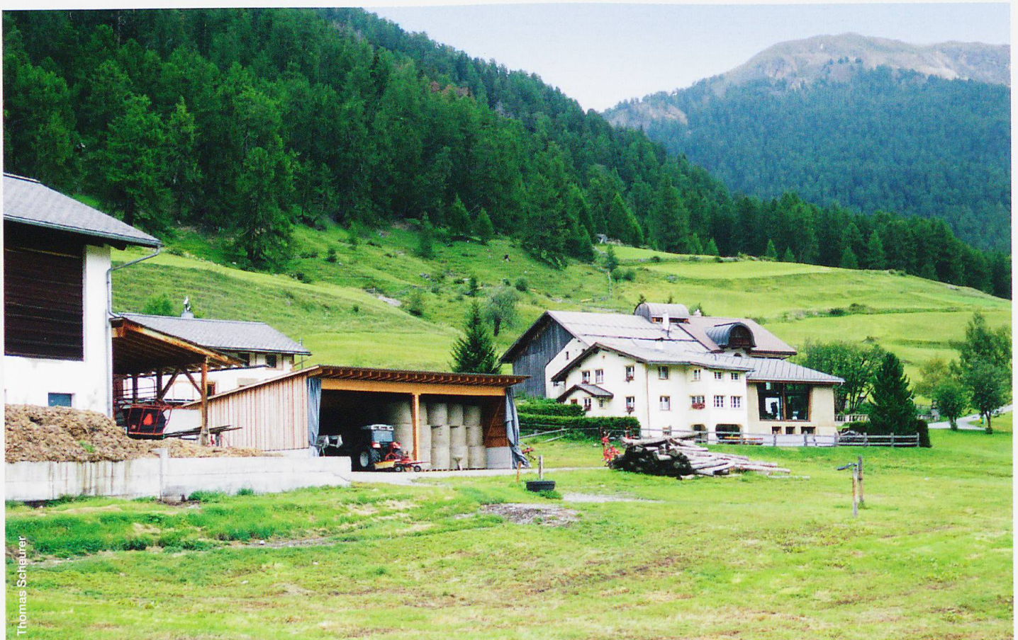
Abb. 1 In den Tällagen (hier in Tschiers) wird überwiegend Viehwirtschaft betrieben. Die bewirtschaftbaren Flächen werden dabei sehr differenziert genutzt.

artige und biologisch vielfältige Naturlandschaften. Die grossteils ökologisch betriebene Landwirtschaft und die Nähe zum Schweizerischen Nationalpark sorgen für ein besonderes Naturjuwel in den Alpen. Das Biosphärenreservat bietet durch gestärkte Kooperationen und gesteigertes Bewusstsein für regionale Wirtschaftskreisläufe Chancen für die Region.