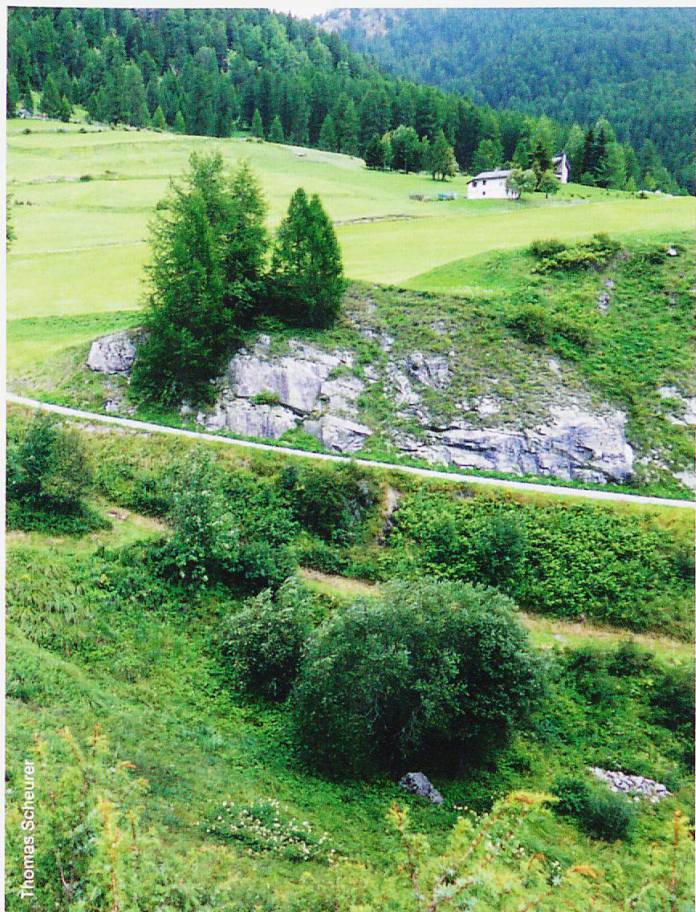
Abb. 4 Die Landwirtschaft schafft eine grosse landschaftliche Vielfalt wie hier bei Tschiers.

Als Sprachrohr für die Region wird besonders der Wiedererkennungswert nach Aussen geschätzt, sei es für den Tourismus, die Produkte oder die kulturellen Besonderheiten der Region ganz allgemein. Ganz klar wird von den interviewten Personen wahrgenommen, dass es Engagement und Unterstützung aus allen Bereichen des Biosphärenreservats braucht, um eine nachhaltige regionale Entwicklung zu fördern: «Wenn wir nichts machen, dann kommt auch nichts. Dann passiert auch nichts» (VM_30), denn «... die Biosfera sind ja wir» (VM_21). Unter diesem Aspekt geschieht auch viel im Biosphärenreservat, wie die Kooperation Agricultura Jaura GmbH zeigt, wo sich mehrere Akteure zusammengeschlossen haben, um einen Beitrag zur regionalen Wertschöpfung zu leisten.