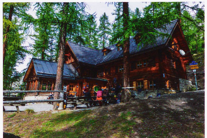
Der Ausgangspunkt: Die Chamanna Cluozza

terkunft für die Parkwächter und Gäste zu bauen. Nach diversen Umbauten und Erweiterungen bietet die Hütte nach über 100 Jahren 63 Plätze in Mehrbettzimmern und Gruppenlagern. Dass sich vor der Hütte Fuchs und Hase gute Nacht sagen, vermag nicht weiter zu überraschen. Weniger bekannt, aber umso penetranter, ist jedoch ein anderes Wesen. Immer dann, wenn es mucksmäuschenstill geworden ist im Haus, macht es sich bemerkbar: Ein vorerst leises Knarren steigert