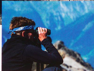
Aussicht vom Feinsten

erste grosse Schweizer Kartenwerk. Coaz, der Bürger von S-chanf war, wurde später erster Eidgenössischer Forstinspektor und hat bei der Gründung des SNP eine wichtige Rolle gespielt. Er blieb bis zu seinem 93. Lebensjahr im Amt, weil er die Realisierung des ersten Nationalparks der Alpen persönlich sicherstellen wollte.