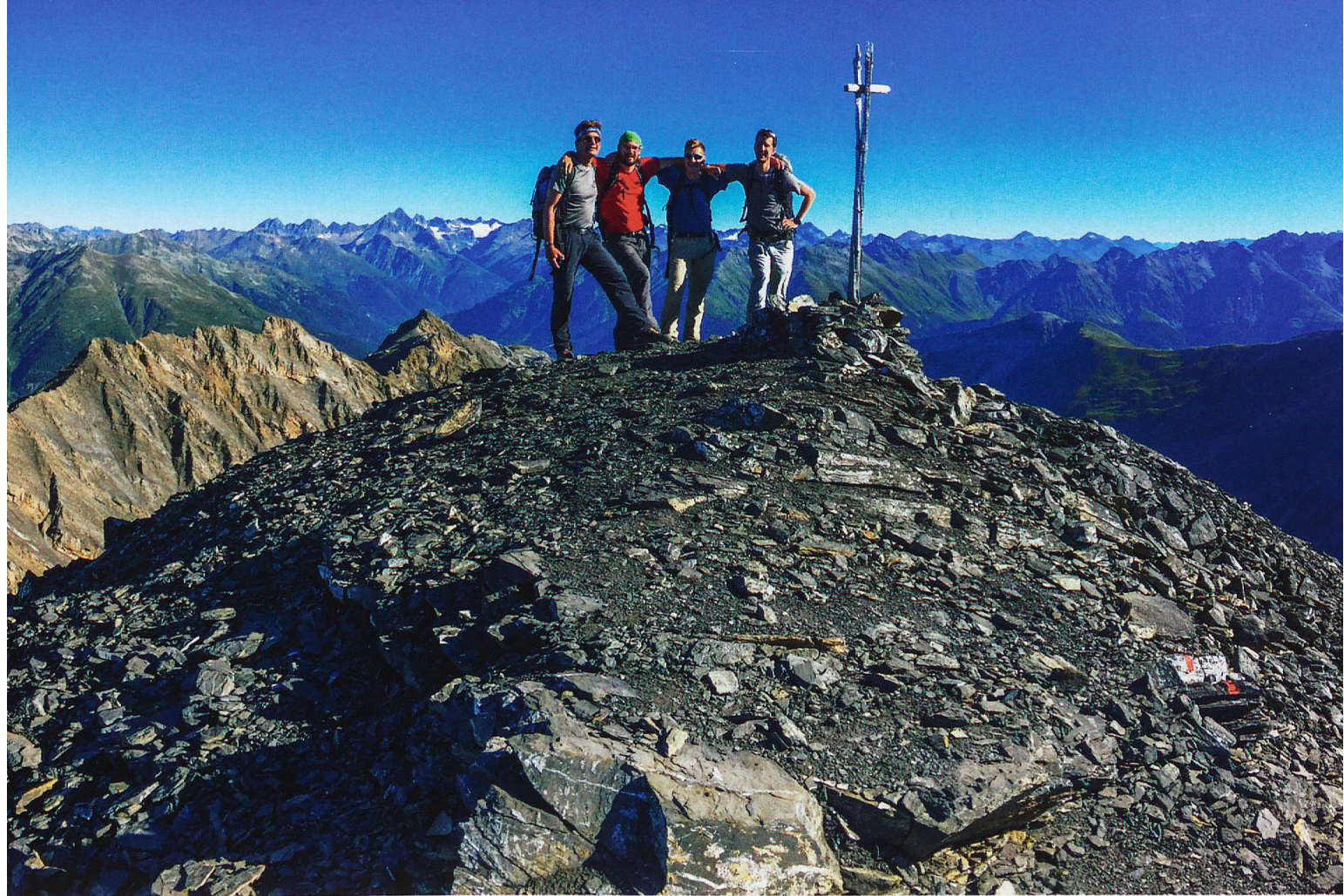
4 «Könige» auf dem Dach des Nationalparks

lässt es sich nicht nehmen, immer wieder Gäste auf den Berg zu begleiten. Mehr zu den buchbaren Touren erfahren Sie am Ende dieses Beitrags.