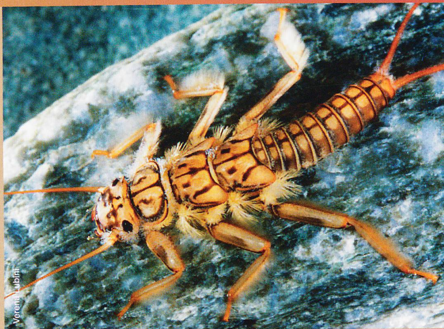
Abb. 2 Die Larve der Steinfliege Perla grandis

Temperaturen beschleunigen, kalte Temperaturen verzögern sie bis zum völligen Stillstand. Gewisse Insekten weichen sehr kalten Temperaturen aus, indem sie als Ei oder Junglarve eine Entwicklungspause (Diapause) einlegen, die erst endet, wenn die Temperatur wieder steigt; wird es aber zu warm, sterben die Larven kaltsteno-thermer Arten ab. Die Temperatur bestimmt auch, in welchem Zeitfenster die Larven sich zum geflügelten Insekt wandeln und das Wasser verlassen. Dadurch ist ein mehr oder weniger synchrones Schlüpfen gewährleistet, so dass sich die Geschlechter in der oftmals nur kurzen zur Verfügung stehenden Zeit auch finden.