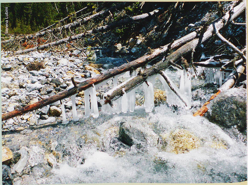
Abb. 1 Ova da Stabelchod im Mai 2012

Wie wirkt sich das auf die Gewässer und ihre Bewohner aus? Messungen der Wassertemperatur an einzelnen Fließgewässern (Abbildung 1) wie dem Spöl und der Ova dal Fuorn sowie an verschiedenen Quellen zeigen, dass sie auch im Sommer im kalten Bereich liegen und höchstens 12 °C erreichen. Die darin lebende Fauna ist an das harsche Klima bestens angepasst. Die Wissenschaft bezeichnet Arten, die sich ausschliesslich in kalten Gewässern aufhalten und entwickeln, als kaltstenotherm. Mit Ausnahme weniger gehören dazu fast alle in den Gewässern des Parks lebenden wirbellosen Arten – allen voran die sich im Wasser entwickelnden Insekten wie die Eintagsfliegen, die Steinfliegen, die Köcherfliegen und die Zuckmücken. Letztere besiedeln hauptsächlich stehende Gewässer und sind in den Macunseen vielfältig vertreten.