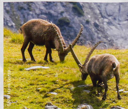
Die Hörner der Steinböcke dienen als Archiv für die Dokumentation von Klimaschwankungen.

«Interessanterweise beeinflusst die Porenöffnungsweite das Kohlenstoff-Isotopenmuster der Pflanze. Und das Klima beeinflusst die Porenöffnungsweite und damit ebenfalls das Isotopenmuster», sagt Schnyder. Kennt er das Isotopenmuster einer Pflanze, kann er sagen, wie gut sie