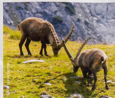
Die Hörner der Steinböcke dienen als Archiv für die Dokumentation von Klimaschwankungen.

«Interessanterweise beeinflusst die Porenöffnungsweite das Kohlenstoff-Isotopenmuster der Pflanze. Und das Klima beeinflusst die Porenöffnungsweite und damit ebenfalls das Isotopenmuster», sagt Schnyder. Kennt er das Isotopenmuster einer Pflanze, kann er sagen, wie gut sie