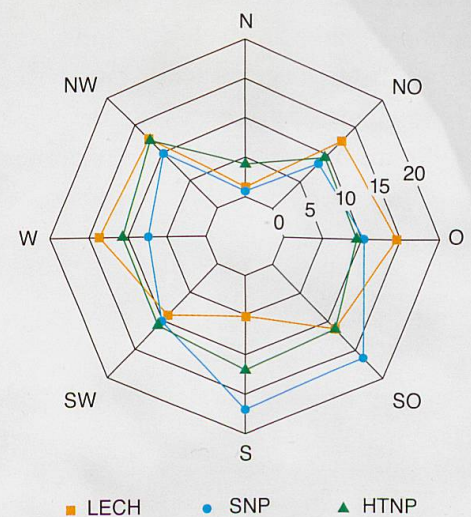
Abb. 1 Prozentuale Verteilung der genutzten Hangausrichtungen in den 3 Untersuchungsgebieten Nationalpark Hohe Tauern (HTNP), Schweizerischer Nationalpark (SNP) und Lechquellengebirge (LECH). Die hohe Nutzung von Südhängen im SNP ist ein Indiz für eine höhere Verfügbarkeit solcher Hänge, entweder aufgrund der topografischen Verhältnisse oder möglicherweise dank dem Schutz vor Störungen, z.B. durch Touristen.

Um dieser Frage nachzugehen, müssen zunächst quantifizierbare Verhaltensweisen des Steinbocks gefunden werden. Eine Möglichkeit, Verhalten zu «messen», bietet die Erfassung des Streifgebietes bzw. des Aktionsraumes. Damit ist die Fläche gemeint, die ein Individuum für regelmässige Aktivitäten wie die Nahrungsaufnahme und das Wiederkäuen in einem bestimmten Zeitraum, zum Beispiel während des Sommers, nutzt. In der Wildtierökologie wird grundsätzlich angenommen, dass diese Grösse mit der Ressourcendichte im Lebensraum in Zusammenhang steht. Sind beispielsweise gute Äsungs- und Rückzugsareale im Habitat häufig, so erübrigen sich viele energieraubende und teilweise gefährliche Wanderungen und der Aktionsraum fällt klein aus. In einer Masterarbeit sollte der Einfluss unterschiedlicher Lebensbedingungen auf den Aktionsraum des Alpensteinbocks untersucht werden. Dazu wurden anhand von GPS-Daten von 24 männlichen Steinböcken aus dem Schweizerischen Nationalpark, dem Nationalpark Hohe Tauern (HTNP) und dem Lechquellengebirge (LECH) Streifgebiete berechnet und deren Grösse in Zusammenhang mit Klima und Topografie gesetzt.