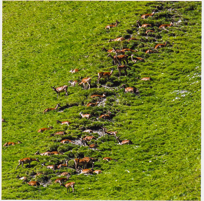
Die Krux des Zählens: Wenn die Tiere wie die Hirschkühe und -kälber im Bild eng beieinanderliegen, braucht es eine systematische Vorgehensweise beim Zählen.

Es war eine typische Sommerzählung, bei der sich die meisten Rothirsche aufgrund der Wärme im hintersten Talkessel aufgehalten haben. Mit insgesamt 568 Rothirschen, 253 Steinböcken und 191 Gämsen in der Val Trupchun sind die Ergebnisse hoch ausgefallen. Aus Sicht des Monitorings ist für die Beurteilung einer Zählung nicht eine hohe Anzahl entscheidend, sondern die vergleichbare Anwendung der Methode. Ist sie korrekt angewandt worden, sind die Ergebnisse vergleichbar. Die Zahlen werden anschliessend bereinigt und digitalisiert. 🦌