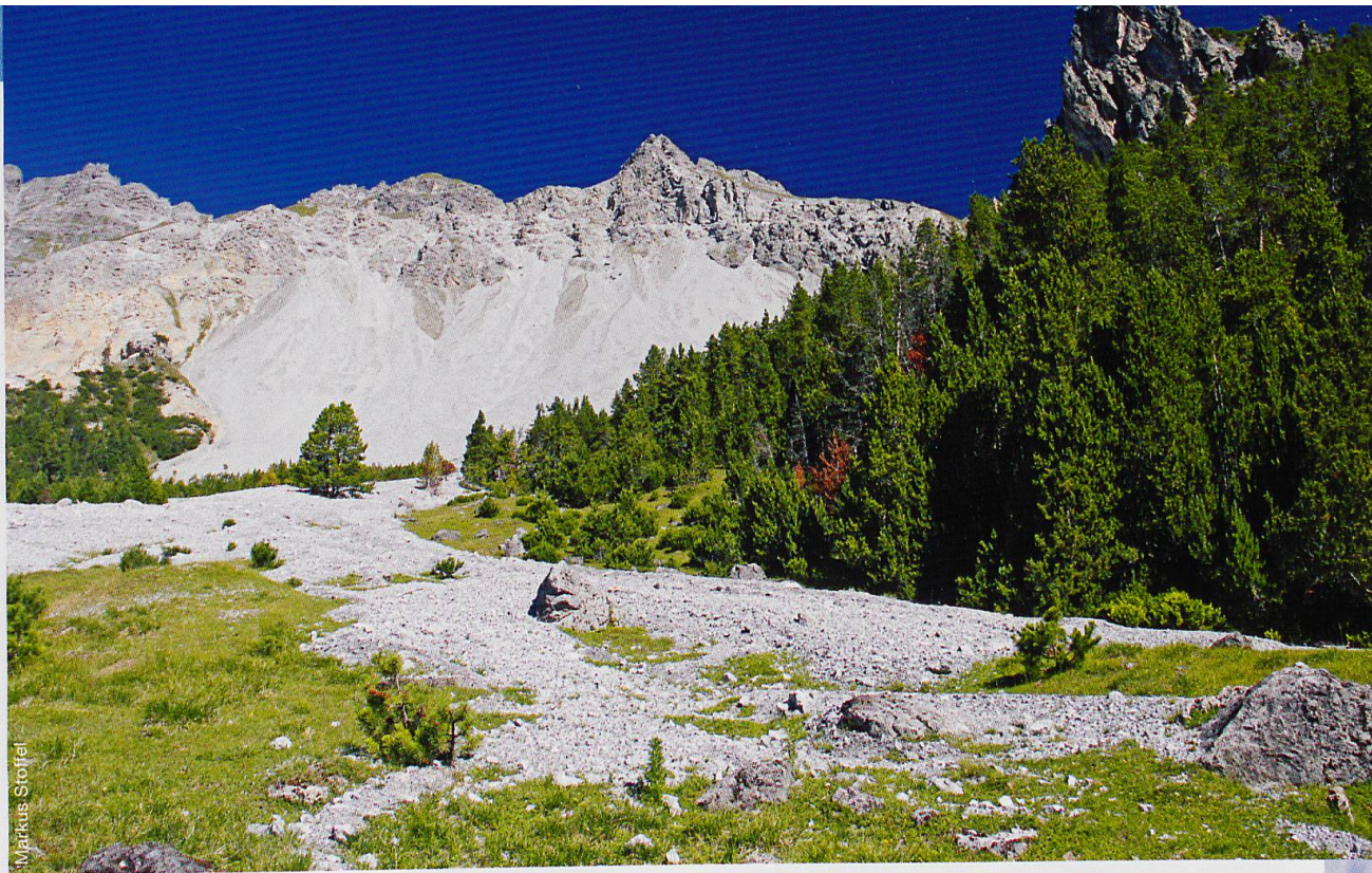
Abb. 2 Aus Schutthalden gelangen heute schon grosse Mengen an Geröll in die Bachläufe – und auch auf Weiden.

Auch langsame Massenbewegungen wie Blockgletscher und Bodenfließen (Solifluktion) sind im Permafrost verbreitet. Zu diesen Bewegungen verfügt der Nationalpark über einzigartige, lange Messreihen, welche wertvolle Einblicke in die längerfristige Entwicklung des «dauerhaft gefrorenen Bodens» und in die Veränderung von Landschaftsformen bei abnehmendem Permafrost erlauben.