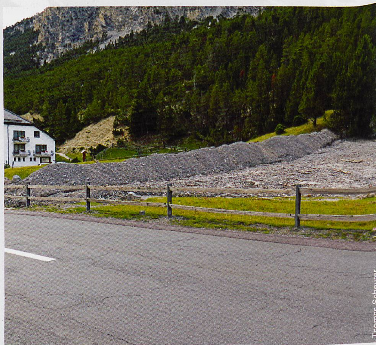
Abb. 1 Natürliche Dynamik: Murgang neben dem Hotel II Fuorn

Seit dem Ende der Kleinen Eiszeit vor gut 100 Jahren, als die Gletscher in den Alpen einen letzten, eindrücklichen Vorstoss verzeichneten, ist die globale Temperatur im Schnitt um rund 0,8 °C angestiegen. Die in den Alpen gemessene Erwärmung ist aber deutlich höher als das globale Mittel und betrug über die letzten 120 Jahre knapp 2 °C. Die verstärkten Auswirkungen des globalen Temperaturanstiegs in Berggebieten lässt sich mit sogenannten «verstärkten Rückkoppelungseffekten» erklären: Je kleiner Eisflächen werden und je kürzer Schnee liegen bleibt, desto stärker werden sich die schnee- und eisfreien Oberflächen erwärmen. Im Alpenraum lassen sich die Auswirkungen der Klimaerwärmung wohl am besten anhand der Gletscher aufzeigen, die jährlich an Länge und Masse verlieren und wohl bis zum Ende des Jahrhunderts, bis auf wenige Ausnahmen, aus dem Landschaftsbild verschwinden werden.