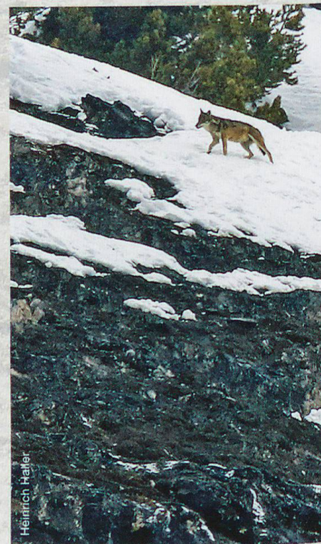
Abb. 2 Einzelner Wolf (offenbar F18) im steilen Gelände oberhalb Il Fuorn, 11. März 2018

In Mittel- und Süditalien überlebten Anfang der 1970er-Jahre rund 100 Wölfe. 1976 wurde die Art landesweit ohne Einschränkung geschützt. Verbunden mit einer verbesserten Nahrungsgrundlage auf der Basis markant erhöhter Bestände wild lebender Huftiere setzte eine dynamische Populationsentwicklung und rasche Ausbreitung ein. Spätestens seit 1983 gehört das Gebiet nördlich von Genua wieder zum ständigen Wolfsareal, 1992 wurden 2 Wölfe im Nationalpark Mercantour in den französischen Seealpen gesichtet, und im Verlauf der folgenden Jahre etablierte sich im südlichsten Abschnitt der Alpen ein Rudel nach dem anderen. Bereits 2012 war ein grosser Teil der französisch-italienischen Westalpen wieder besiedelt; man zählte 33 Wolfsrudel und 5 Wolfspaare.