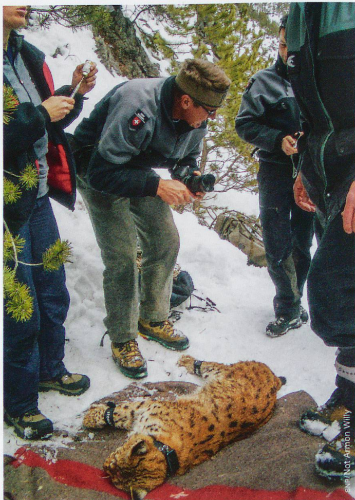
Luchsfang am 22. Februar 2008

Beim Wolf hatte ich die Rückkehr erwartet, bei den anderen beiden Arten nicht unbedingt. Beim Braunbären hat die Auswilderung im italienischen Trentino um die Jahrtausendwende eine neue Ausgangslage geschaffen. Trotzdem hätte ich nicht gedacht, dass die Dynamik der Population im Trentino so gross sein würde und dass fast jedes Jahr mindestens ein Bär im SNP auftaucht. Der Besuch des Luchses war ein Einzelfall, der sich seither nicht wiederholt hat. Für mich war der 22. Februar 2008 mit dem gelungenen Einfang und der Besenderung von Luchs B132 einer meiner emotionalen Höhepunkte in all den Jahren als Nationalparkdirektor.