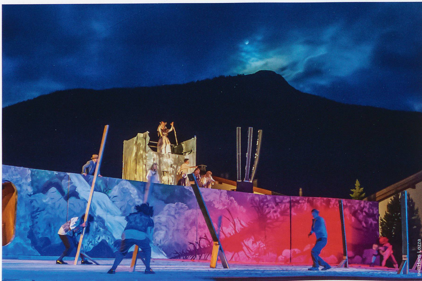
Das Freilichtspektakel LAINA VIVA anlässlich des Jubiläums 100 Jahre Schweizerischer Nationalpark sorgte für unvergessliche Momente.

Ist es der gleiche Nationalpark wie vor 23 Jahren oder wenn nein, was hat sich verändert?