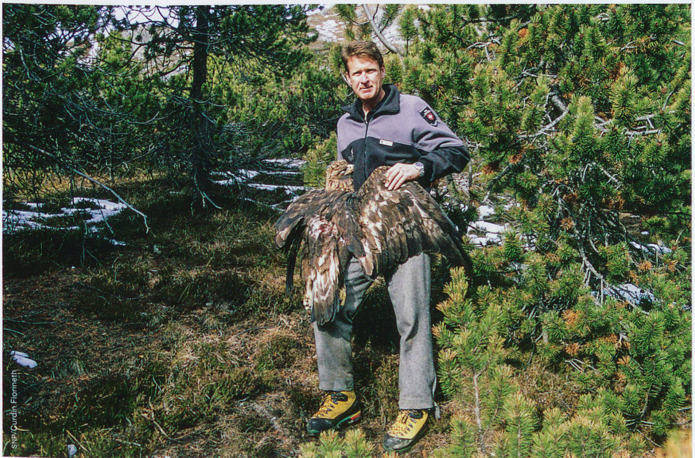
Trauriger Höhepunkt seiner Recherchen zum Thema Wilderei: Der Fund eines abgeschossenen Steinadlers an der Nationalparkgrenze

Solange es Wildtiere gibt, wird es auch Wilderer geben. Aber im SNP haben wir die Situation seit mehr als 10 Jahren im Griff. Im Rahmen unseres Monitorings von Wildtieren sind Hunderte von automatischen Kameras, sogenannte Fotofallen, aufgestellt worden. Dies schreckt Frevler ab. Dazu kommen erhöhte Gebietskontrollen, auch im grenzüberschreitenden Rahmen.