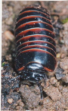
Abb. 3 Glomeris alpina , ein Tausendfüßler, der wesentlich zum Abbau von totem Pflanzenmaterial im sNP beiträgt.