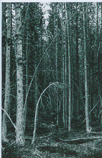
Abb. 1 Fotoserie der Dauerfläche Stabelchod von 1926 bis 2013. Die Stammzahl nimmt kontinuierlich ab, aber erst nach 1987 beginnen grosse Bäume abzusterben und der Wald verjüngt sich.

Die Waldforschung hat es im Nationalpark quasi mit einem Unikat zu tun: Bergföhrenwälder mit etwa 170 bis 200 Jahre alten Bäumen, die nach Kahlschlag entstanden und dann bis zur Parkgründung 1914 kaum und nach 1931 gar nicht mehr bewirtschaftet worden sind. Sie sind ein anschauliches Beispiel dafür, wie sich Wälder nach grossflächigen Störungen