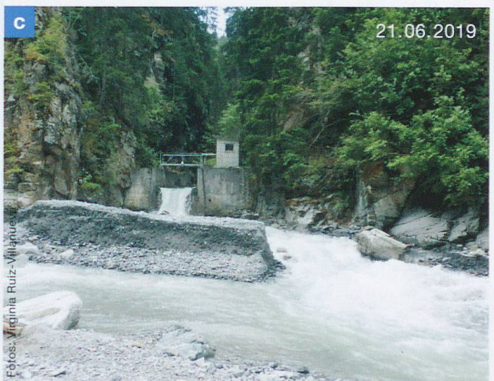
Abb. 2 Aufschüttung mit Sedimenten (a) aus der Ova da Cluozza an der Stelle, wo sie in den unteren Spöl mündet. Die Sedimente werden sowohl durch künstliche Abflüsse im Spöl als auch durch natürliche Hochwasser in der Ova da Cluozza regelmässig remobilisiert (b, c) und wandern langsam flussabwärts. Pegelstation (ID 2319) des Bundesamts für Umwelt mit kontinuierlichen Messungen von Wassertiefe und Abfluss