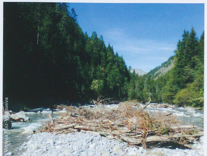
Abb. 1 Schwemmholz (hier am Spöl) bietet Lebensraum, schafft Artenvielfalt, baut Strömungsenergie ab, verstärkt aber auch Sedimentablagerung flussaufwärts und birgt Risiken in sich.

im Fluss – und Sedimente schaffen Lebensräume für lebende Organismen und Pflanzen und unterstützen reichhaltige und vielfältige Lebensgemeinschaften. Ein Flusslebensraum ist das Ergebnis eines Gleichgewichts zwischen Wasser, Sedimenten, Schwemmholz und der Ufervegetation. Der Wasserfluss hat die hydraulische Energie, um Sedimente zu erodieren, zu transportieren und abzulagern. Die Ufervegetation kann abgelagerte Sedimente verfestigen und die Erosionsfähigkeit des Wassers reduzieren. Durch die Interaktion mit der