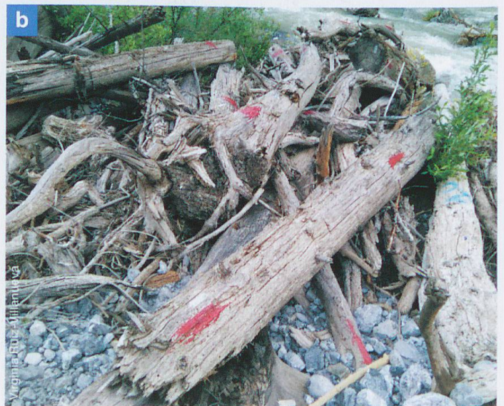
Abb. 3 a) Einer von mehr als 6000 Kieselsteinen nach dem ersten experimentellen Durchfluss im Jahr 2019, die mit geeigneter Farbe markiert wurden. b) Die Markierung und Bemalung von Schwemmholz ermöglichte es uns, ihr Schicksal nach dem ersten Durchfluss im Jahr 2019 zu verfolgen.

Vorläufige Ergebnisse zeigen, dass die Strömungen feines Material wie feinen Kies, Sand und Silt leicht in Bewegung brachten und sogar vollständig abtransportierten, während gröberes Material wie grober Kies und Geröll nur kurze Strecken von bis zu einigen 100 m zurücklegte. Nur ein kleiner Teil des Schwemmholzes wurde von den Strömungen mobilisiert, wovon einzelne Stücke jedoch relativ weite