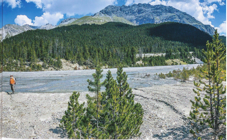
Der Schweizerische Nationalpark – ein weites Forschungsfeld. Hier bei der Einmündung der Val Brüna ins Fuorn-Tal. Bei Starkniederschlägen werden diese Flächen regelmässig durch Hochwasser und Murgänge überflutet. Ein äusserst dynamischer Lebensraum.