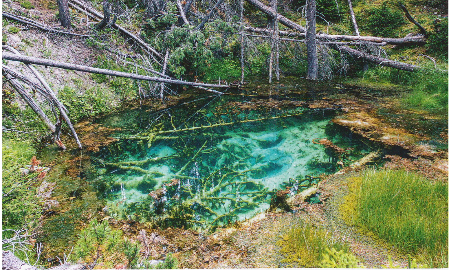
Die Schwefelquelle bei Il Fuorn tritt am Grund einer Doline aus. Von den Wanderwegen aus ist die Quelle nicht sichtbar. Das Wasser ist extrem sauerstoffarm.

Du hattest das Privileg, in einer Zeit als Geologe tätig gewesen zu sein, in der man noch eine Art Universalgelehrter sein konnte. Das zeigt sich ja auch in den sehr unterschiedlichen Projekten, die du betreut hast. Deshalb die Frage: Würdest du heute nochmals Geologie studieren?