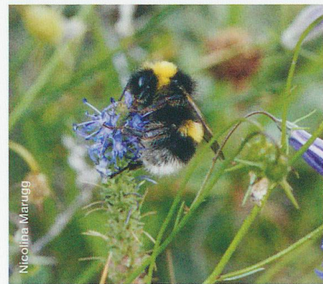
Erdhummel Bombus terrestris

Seit dem Frühjahr sind im Projekt Wilde Nachbarn , welches zusammen mit dem Regionalen Naturpark Biosfera Val Müstair durchgeführt wird, blütenbestäubende Insekten mit Schwerpunkt auf Wildbienen im Fokus. Wir nehmen gerne alle Beobachtungen unter evm.wildenachbarn.ch auf. (aa)