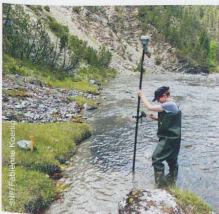
Eine Mitarbeiterin des Schweizerischen Nationalparks beim präzisen Einmessen der Probestandorte

Der Schweizerische Nationalpark, die Engadiner Kraftwerke sowie die Umweltverbände Pro Natura, WWF und Aqua Viva sind daran, ein neues, optimiertes Sanierungsprojekt für den mit Polychlorierten Biphenylen (PCB) belasteten Fluss Spöl zu erarbeiten. Im Vergleich zur verfügbaren Sanierung soll mit der neuen Variante nicht nur die