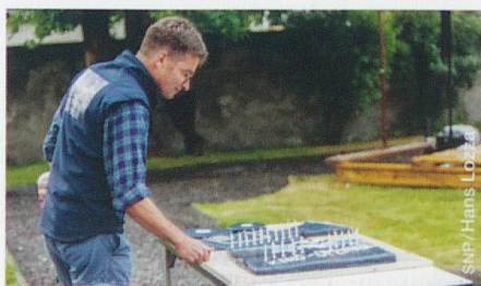
Kino zum Geniessen

Insgesamt besuchten 755 Kino-Fans die sechs Filmabende und genossen stimmungsvolle Stunden bei einem vielfältigen Filmprogramm, Geselligkeit und leckerer Verpflegung. (st)