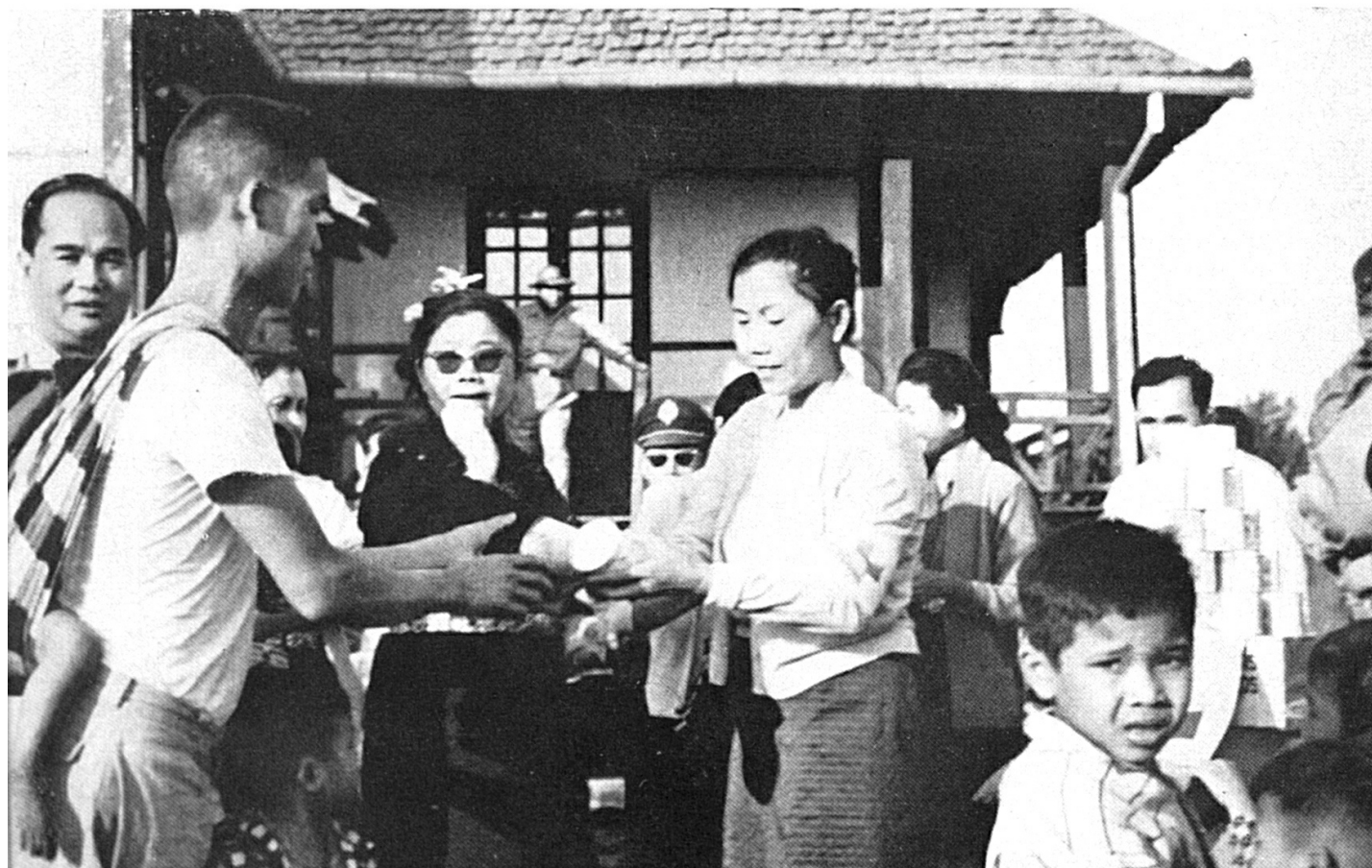
LAOS — Lait et vêtements, dons du CICR, sont distribués par la Croix-Rouge lao aux réfugiés de la province de Paksé (février).