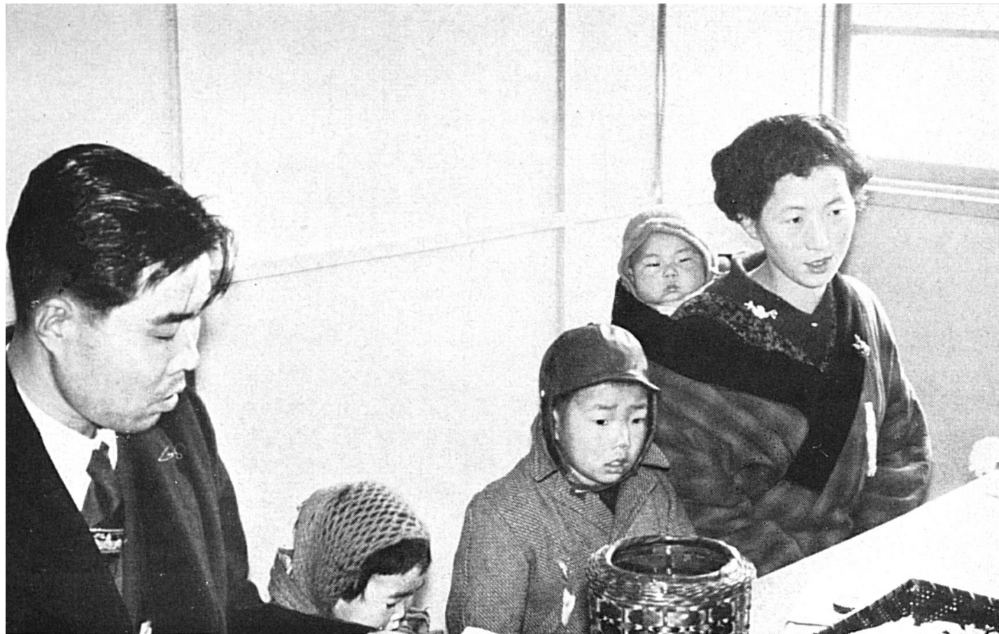
JAPON — En vue de son rapatriement, une famille coréenne s'inscrit au centre de Niigata (février).