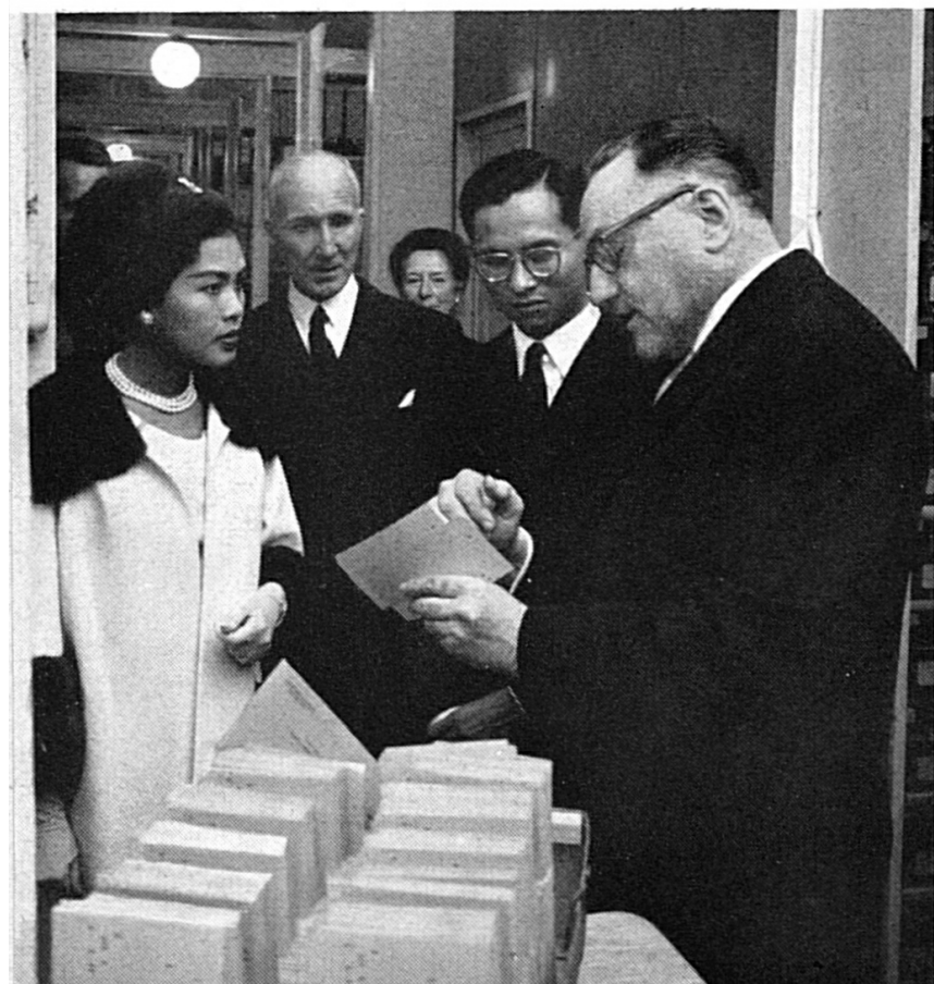
AU SIÈGE DU CICR, À GENÈVE — Les souverains de Thaïlande visitent l'Agence centrale de recherches (novembre).