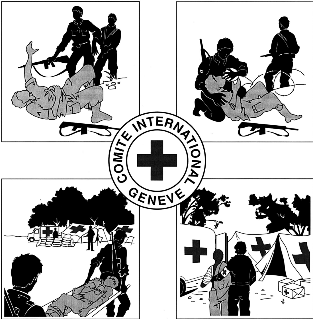
Bande dessinée reproduite sur les colis alimentaires distribués dans l'ex-Yougoslavie, au rythme de 300 000 à 500 000 unités par mois.