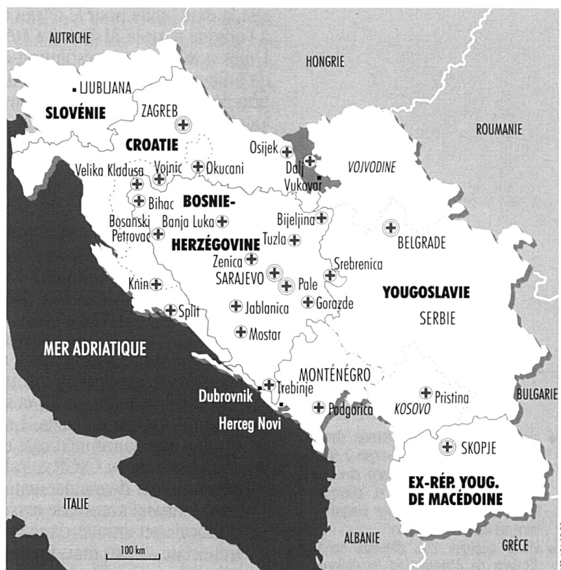
⊕ Délégation CICR ⊕ Sous-délégation/bureau CICR [hachures] Anciens Secteurs nord, sud et ouest [gris] Secteur est

La situation en Croatie est devenue provisoirement plus calme lorsque, à la suite de négociations intensives, le mandat des Nations Unies a été prolongé et