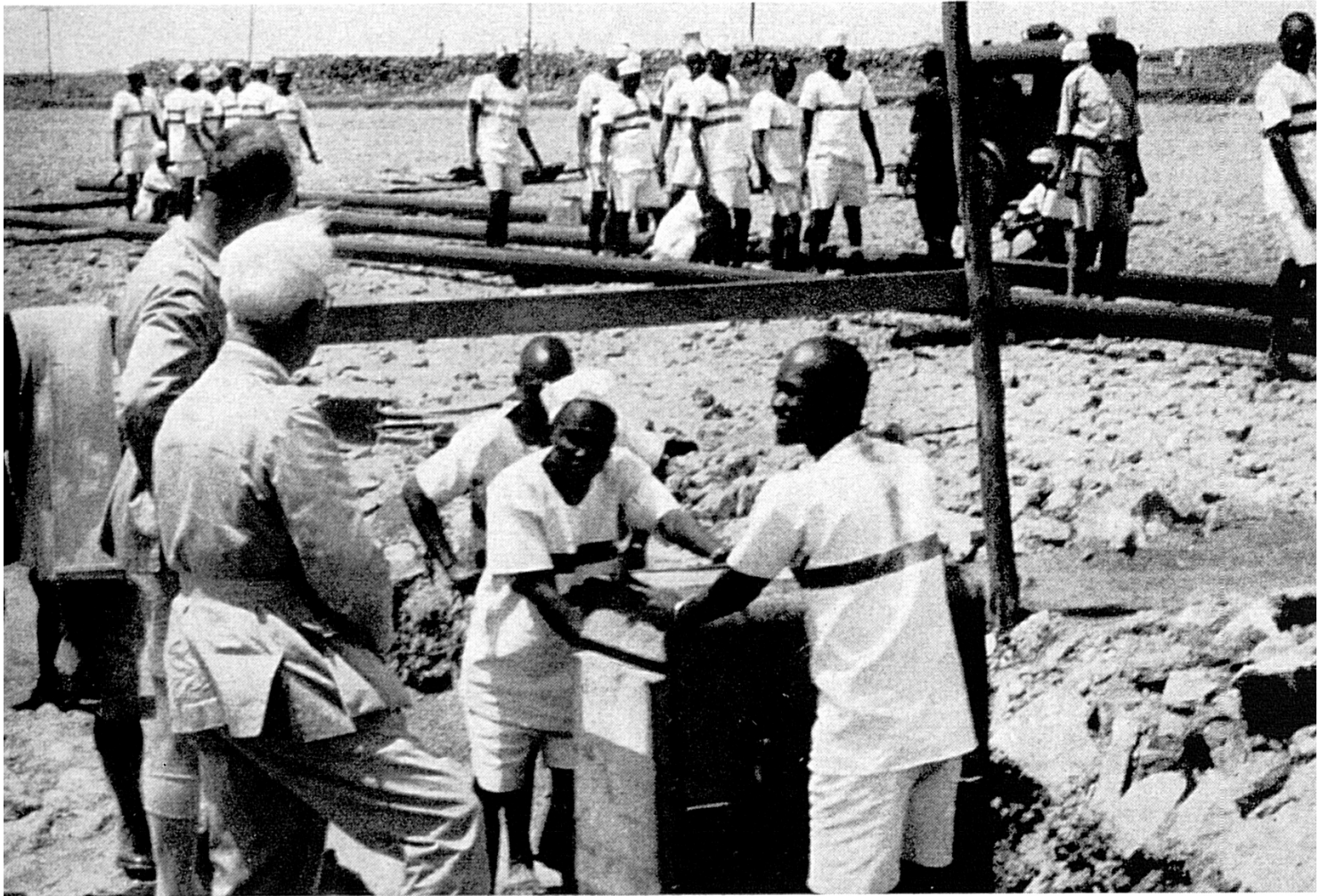
En un campamento de trabajo, en el Kenia, los Delegados del CICR se entrevistan sin testigos con los detenidos