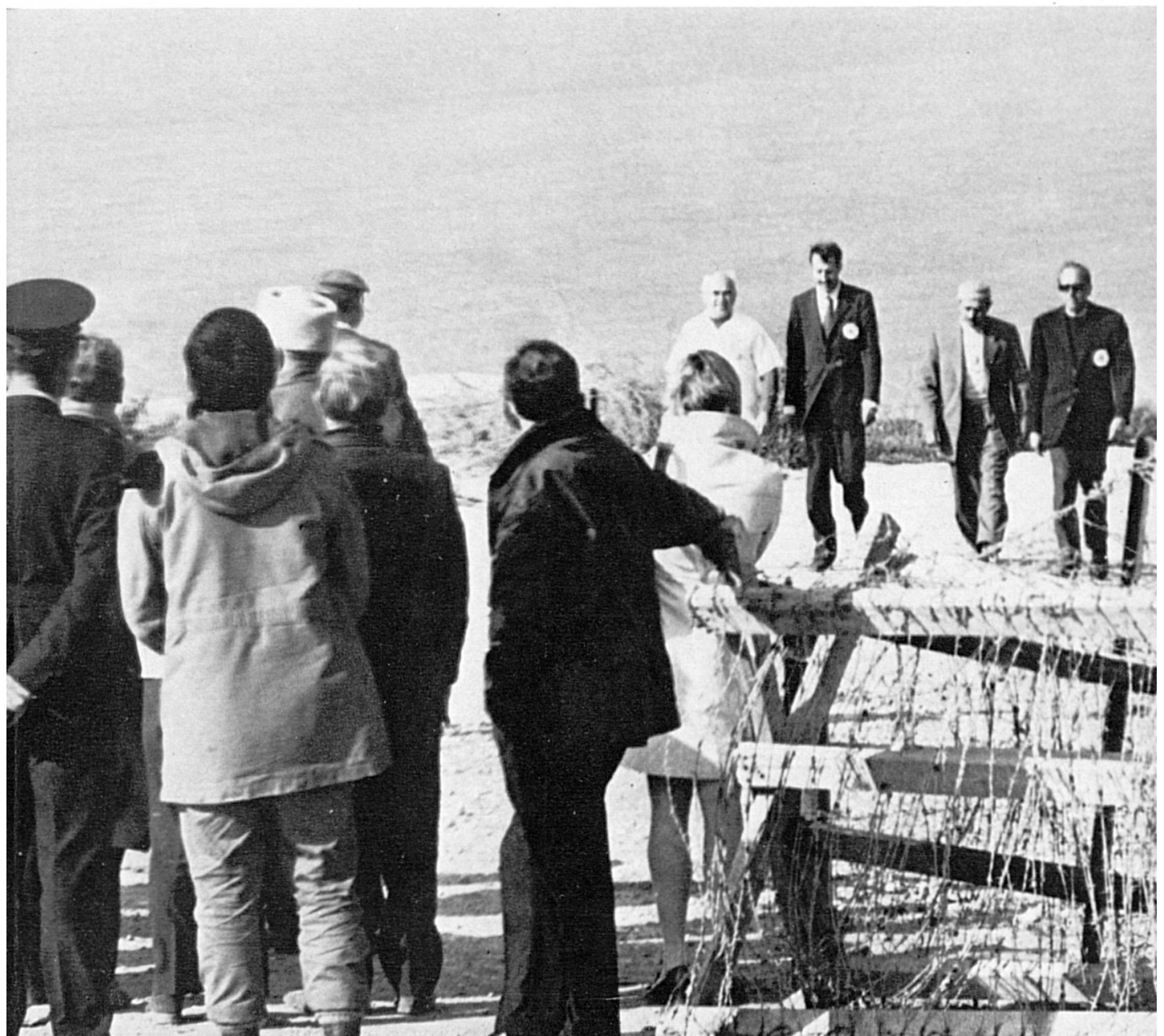
Rapatriación de un internado civil en la frontera israelolibanesa, el 28 de febrero de 1971.