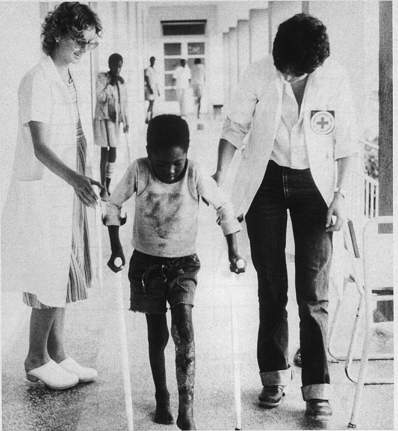
Centro ortopédico de Bomba Alta, en Huambo (Angola)