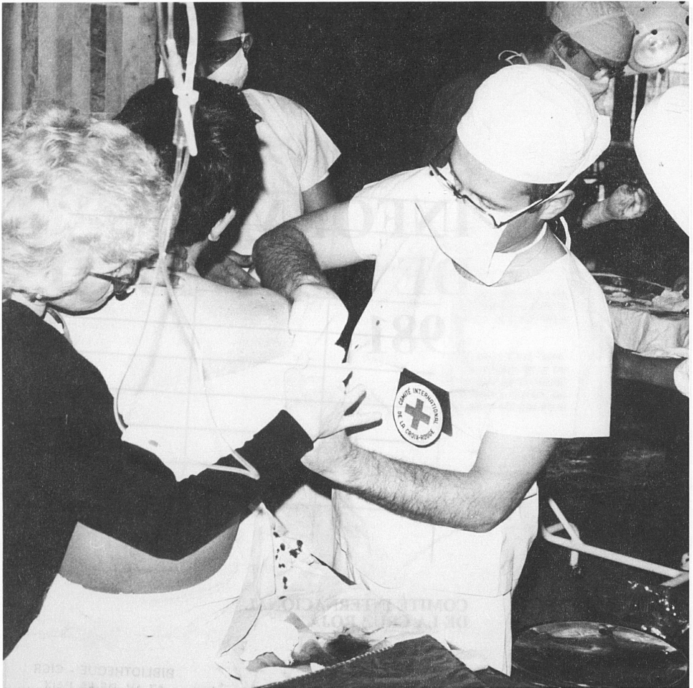
Intervención quirúrgica en el hospital del CICR en Peshawar (Pakistán), donde se atiende a afganos, civiles o combatientes, víctimas de los enfrentamientos en el interior de Afganistán.