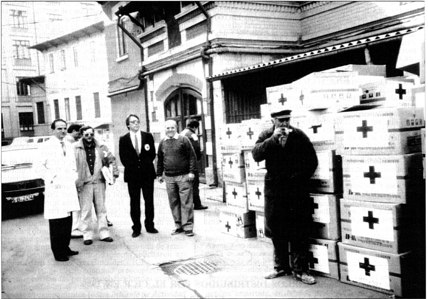
Asistencia médica en un hospital de Bucarest (Rumanía).