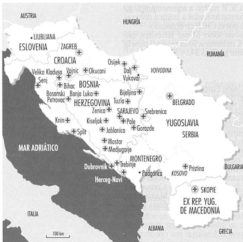
⊕ Delegación CICR ⊕ Subdelegación / oficina / misión CICR ⊗ Zonas protegidas por las Naciones Unidas