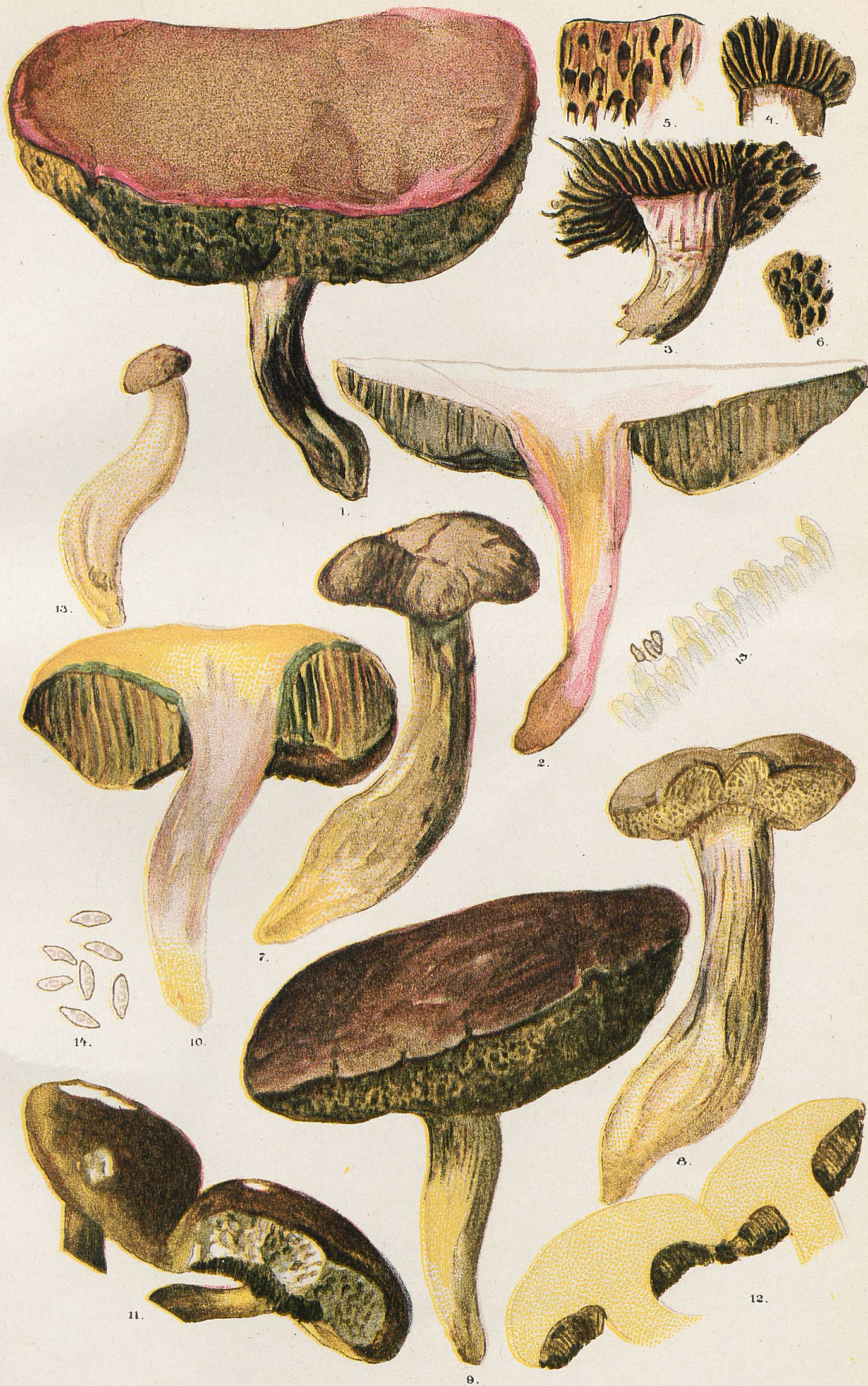
1-10 et 13, Sous-espèce sublevipes. - (3 et 4, tubes en lamelles vers le pied du N°1. - 5, Pores à la marge du N°1. - 6, Pores au milieu du N°1. - 13, Marge de tube. - 14, Spores). - 11 et 12, Sous-espèce sulcatipes.