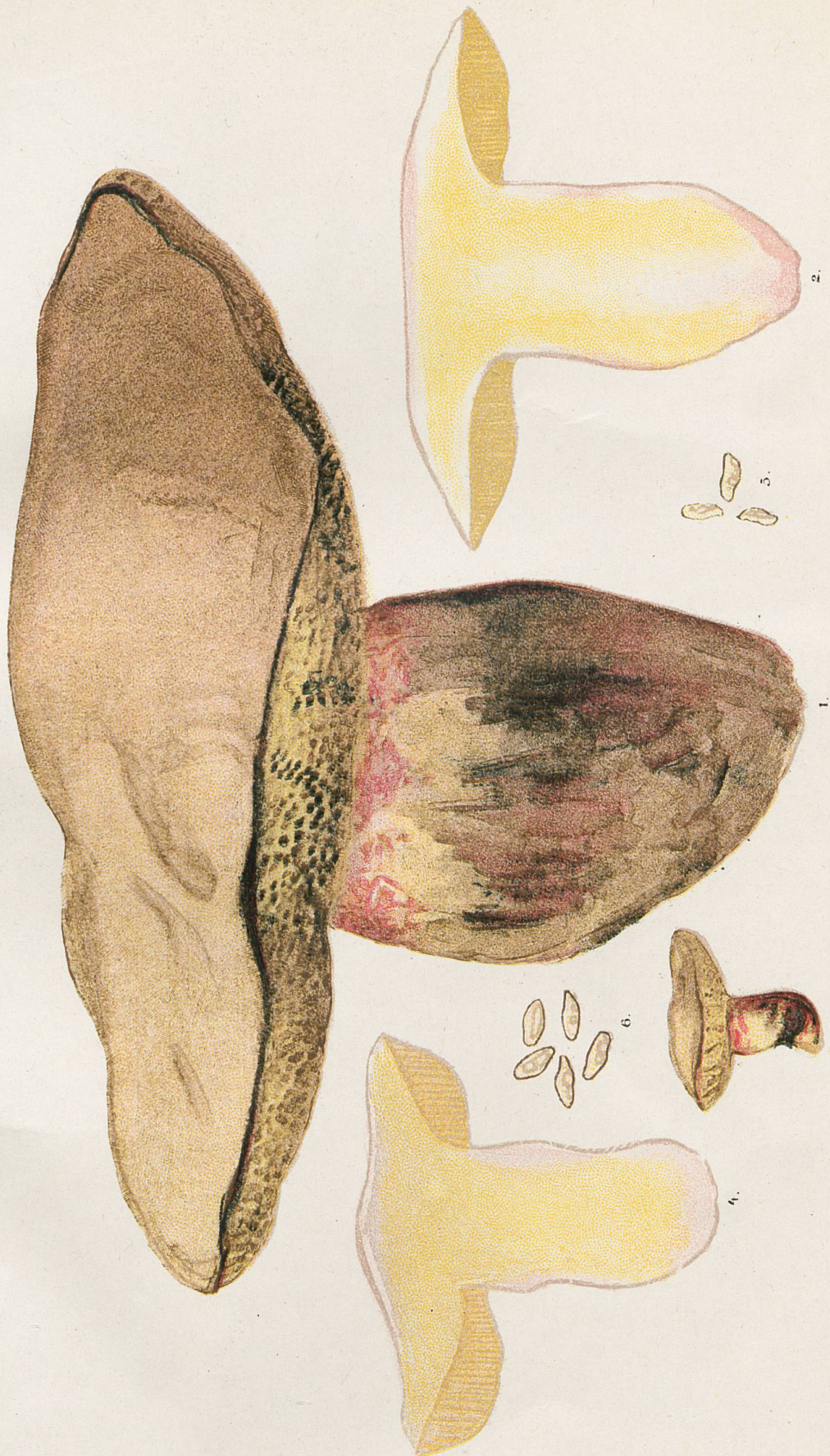
Sous-espèce validus. -1, Grandeur naturelle.-2, Demi. 3, Un septième.-4, Un tiers grandeur naturelle.