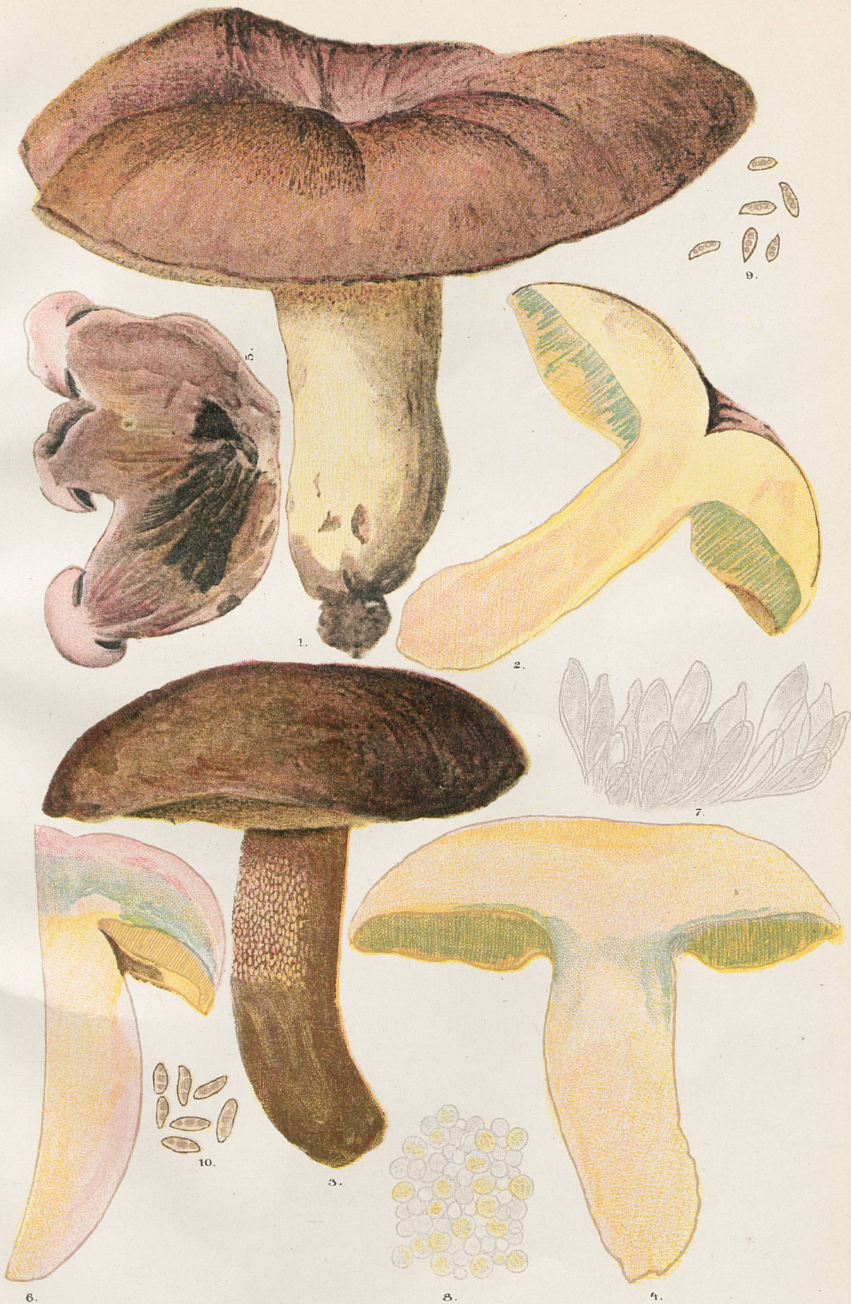
1-6, Sous-espèce irideus . - 7, Marge de tube. - 8, Hyménium vu par transparence 9, Spores du N°1. - 10, Spores du N°3.