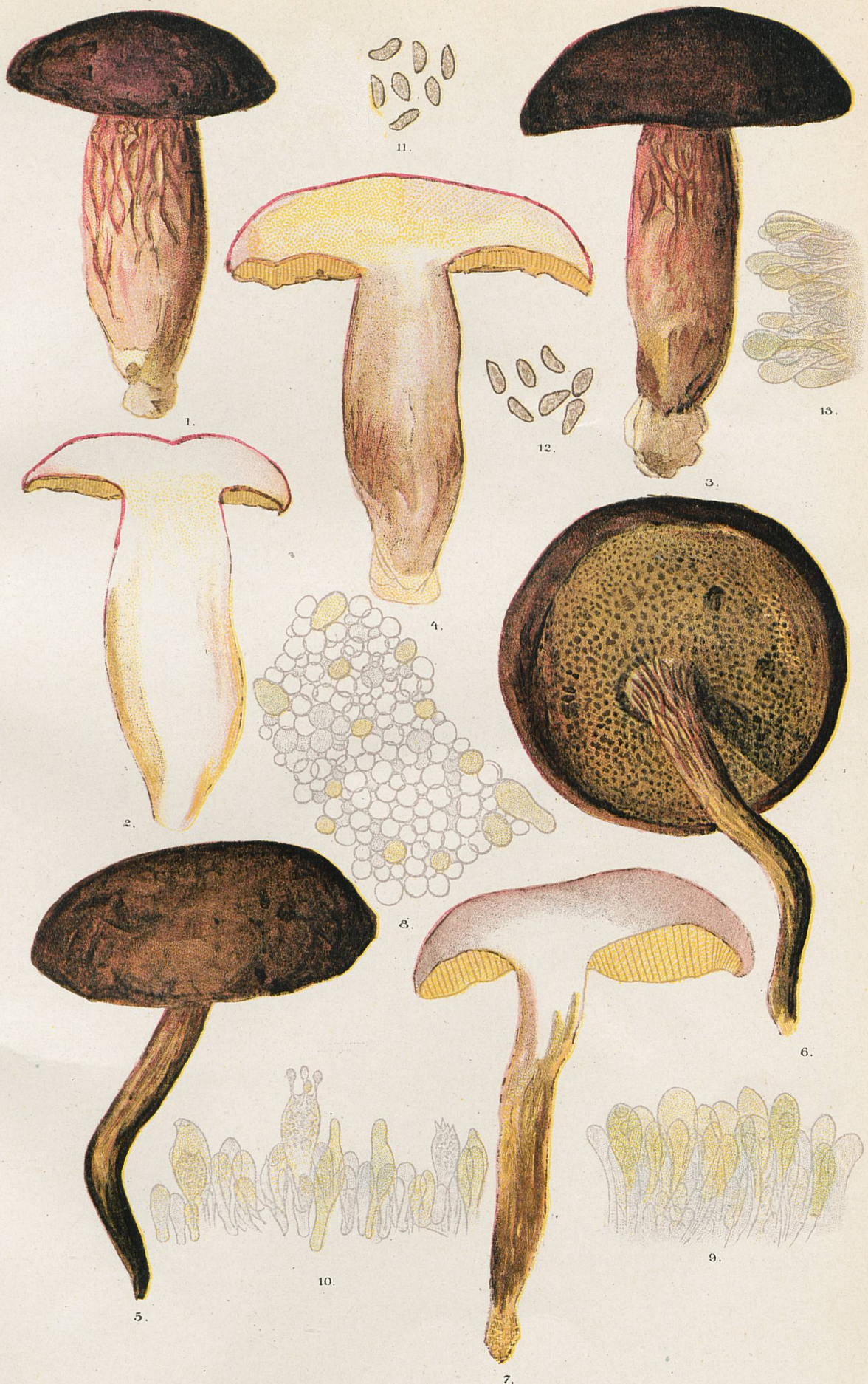
1-7, Sous-espèce reticulatipes . - 8, Hyménium vu par transparence. - 9, Marge de tube. - 10, Coupe de tube. 11 et 12, Spores. - 13, Coupe de nervure du pied.