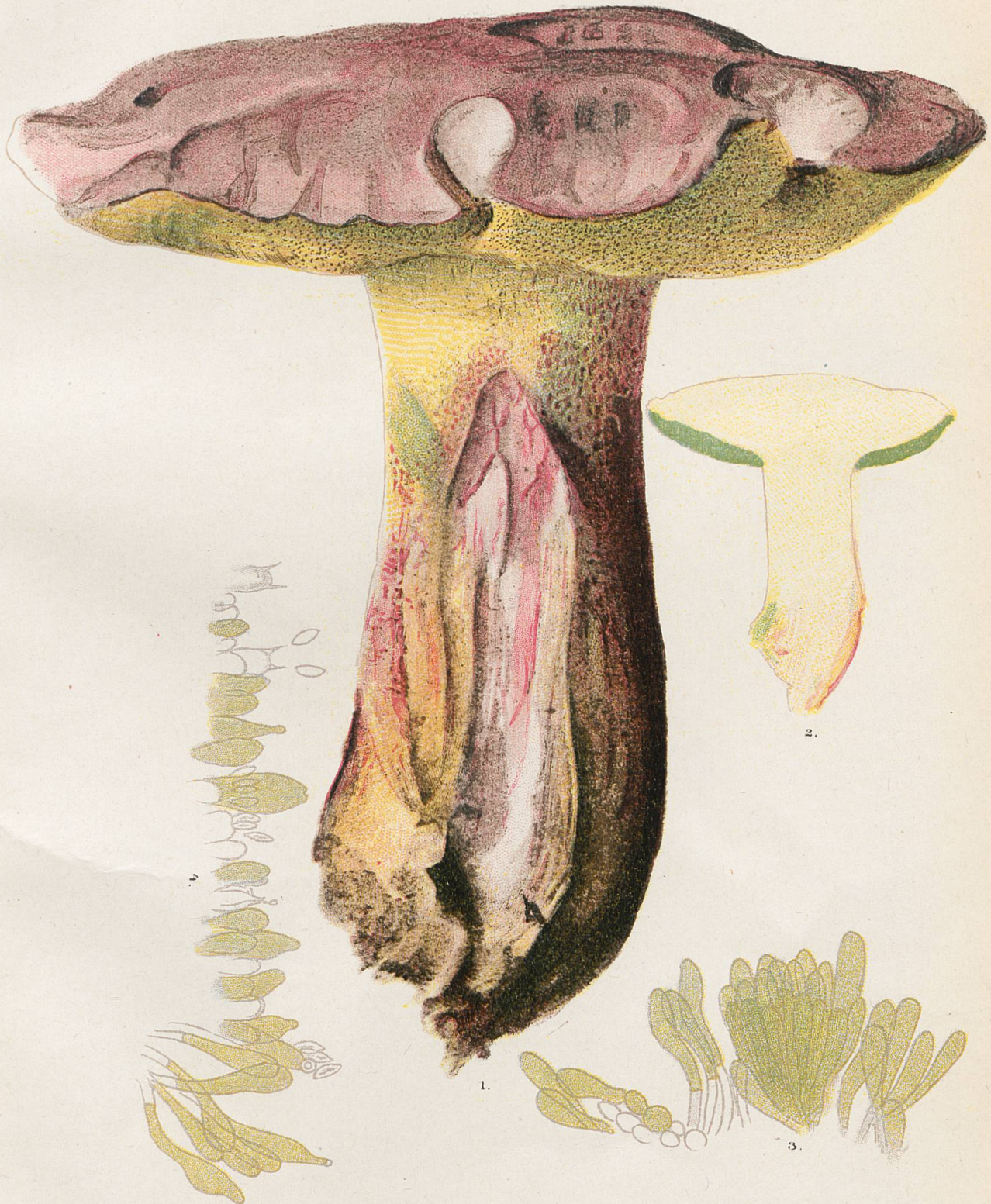
1 et 2, Sous-espèce cerasinus . 3 et 4, Marges de tubes, pris en des points différents d'un punctalipes provenant de Braz-de-Fort.