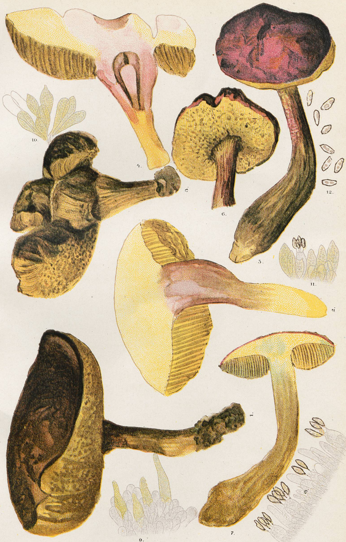
1-7, Sous-espèce sublevipes . - 8, Marge de tube lamelliforme. - 9, Marge de tube normal. 10 et 11, Autres marges de tube. - 12, Spores du N o 5.