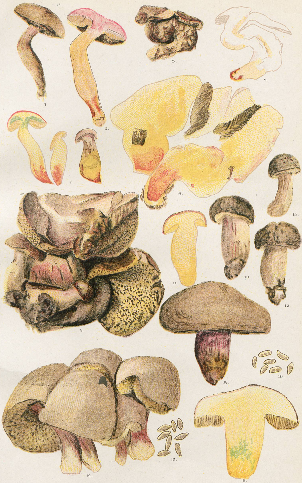
1-7, Sous-espèce dedivitatum . - 8-15, Sous-espèce subluridus . - 15, Spores du N o 14. - 16, Spores du N o 5.