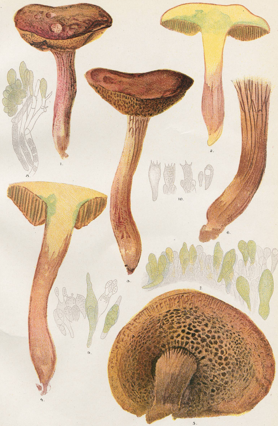
1 et 2. Sous-espèce costatipes . - 3-6, Sous-espèce reticulatipes . - 7 et 8, Marges de tubes. 9 et 10, Basides et cystides.