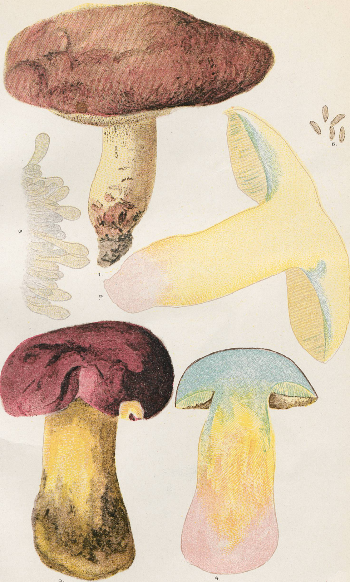
1 et 2, Sous-espèce irideus . - 3 et 4, Sous-espèce cerasinus . - 5, Marge de tube d'un irideus provenant de Langwies. - 6, Spores d' irideus .