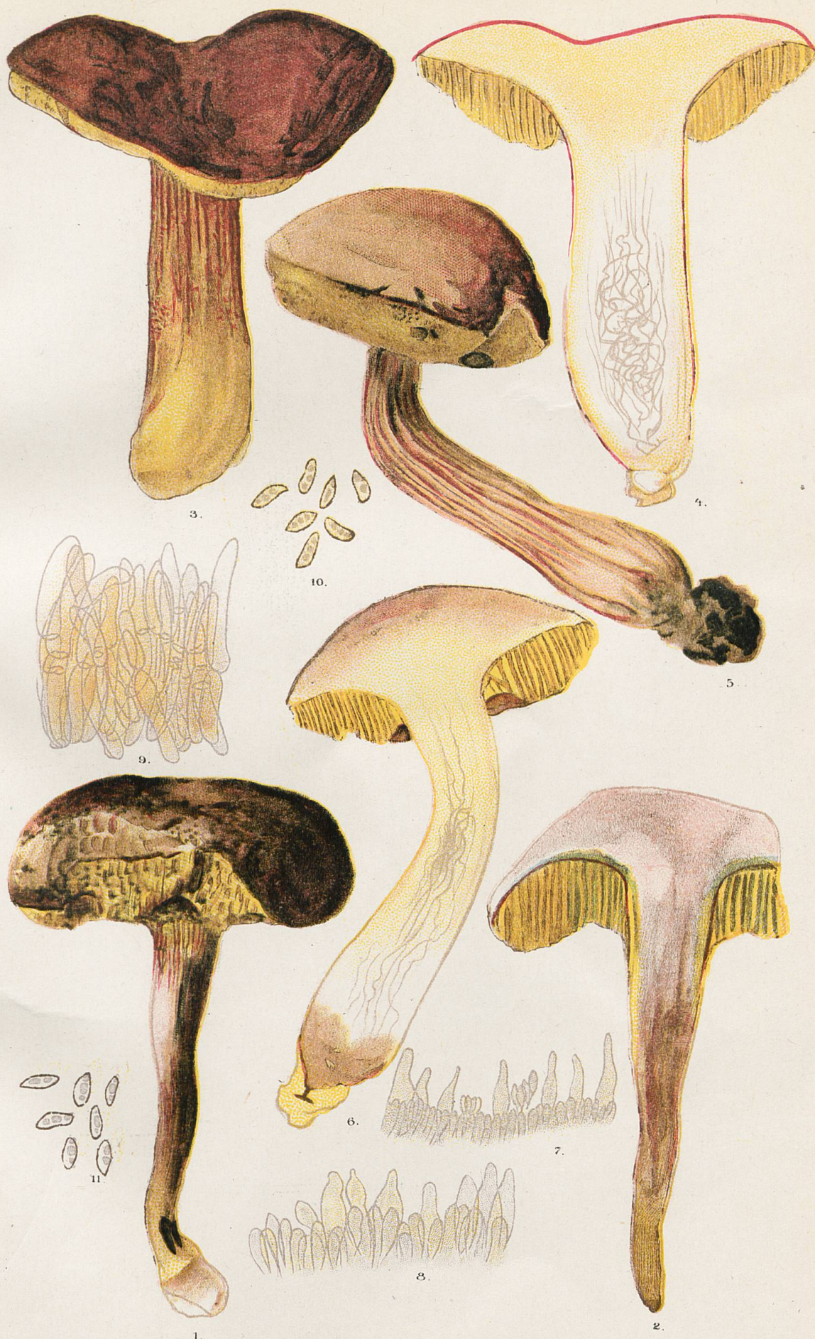
1 et 2, Sous-espèce sulcalipes . - 3 à 6, Sous-espèce costatipes . - 7, Coupe microscopique de nervure au sommet du pied. - 8 Id. à 5 mm. de la couche des tubes. - 9, Tomentum du chapeau. - 10, Spores du N°3. - 11, Spores du N°1.