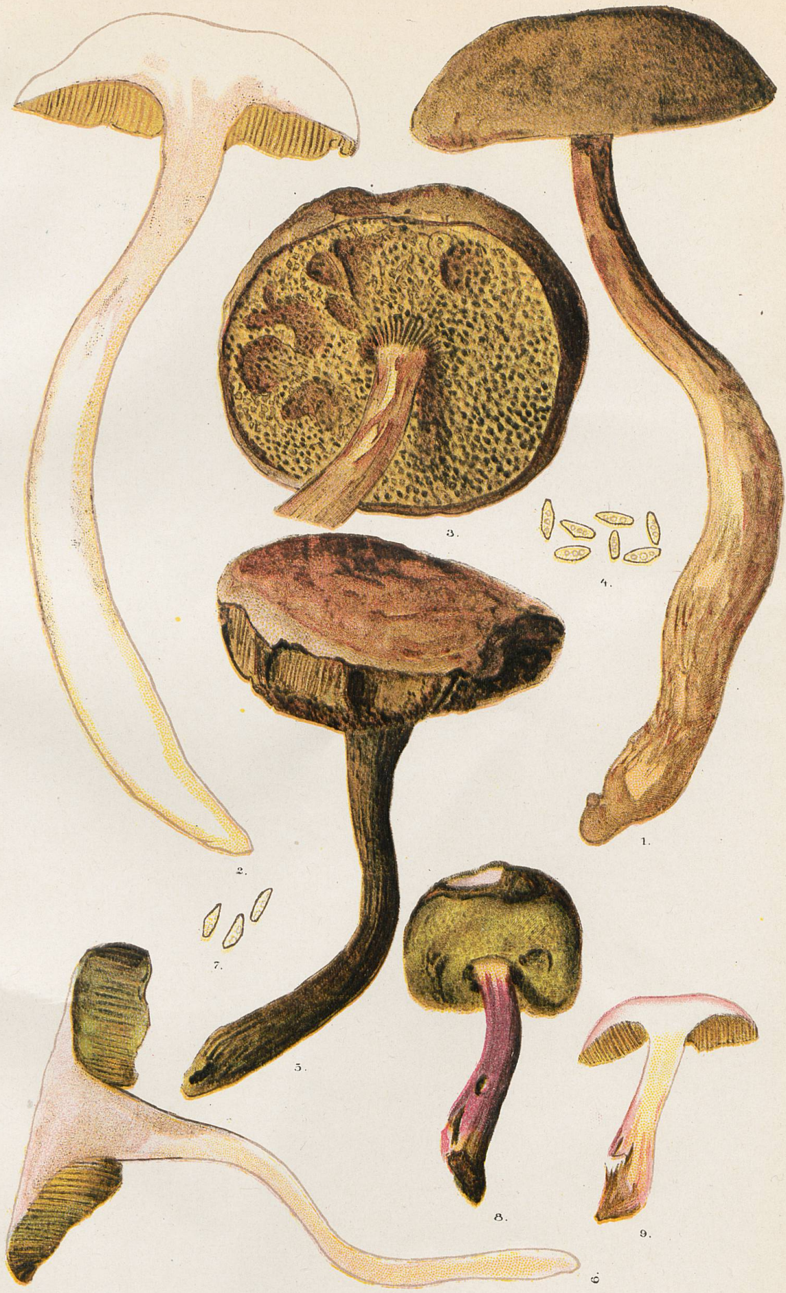
Formes de forêts de conifères.

1-4, Chapelle-Rambaud. - 5-7, Chalel-à-Gobet. - 8 et 9, Palézieux.