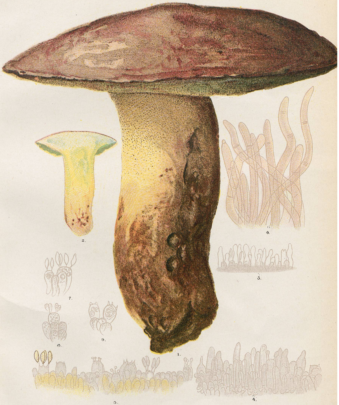
1 et 2. Sous-espèce irideus . - 3. A la marge d'un tube de la fig. 3 pl. VII. - 4. A la marge d'un tube jeune de la fig. 5, pl. I. - 5. A la marge d'un tube vieux de la fig. 5 pl. I. - 6. Tomentum d'un individu provenant de Praz-de-Fort