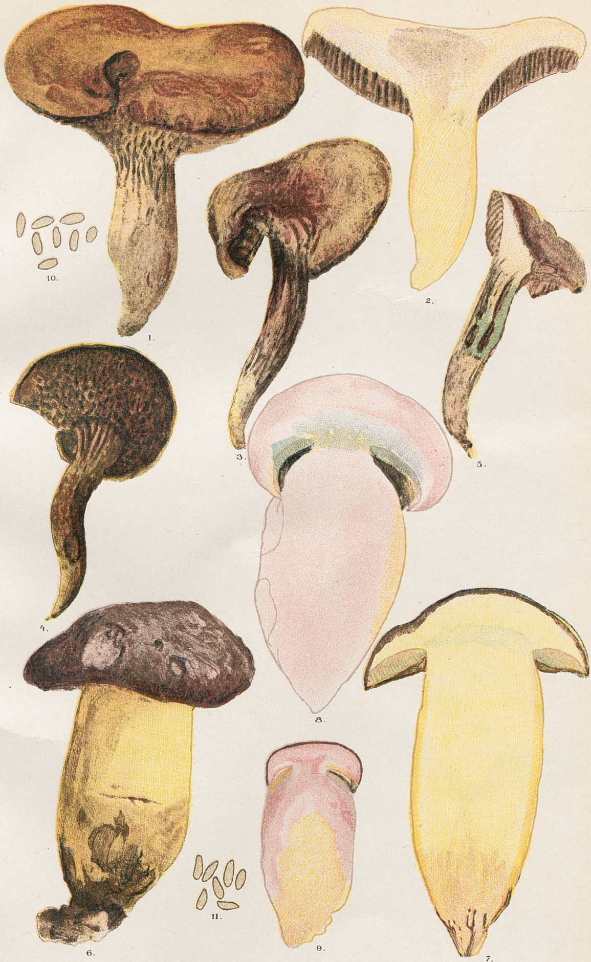
1-5, Sous-espèce Flavens . - 6-9, Sous-espèce irideus . - 8 et 9, Coupe d'individus non figurés. 10, Spores du N° 1. - 11, Spores du N° 6.