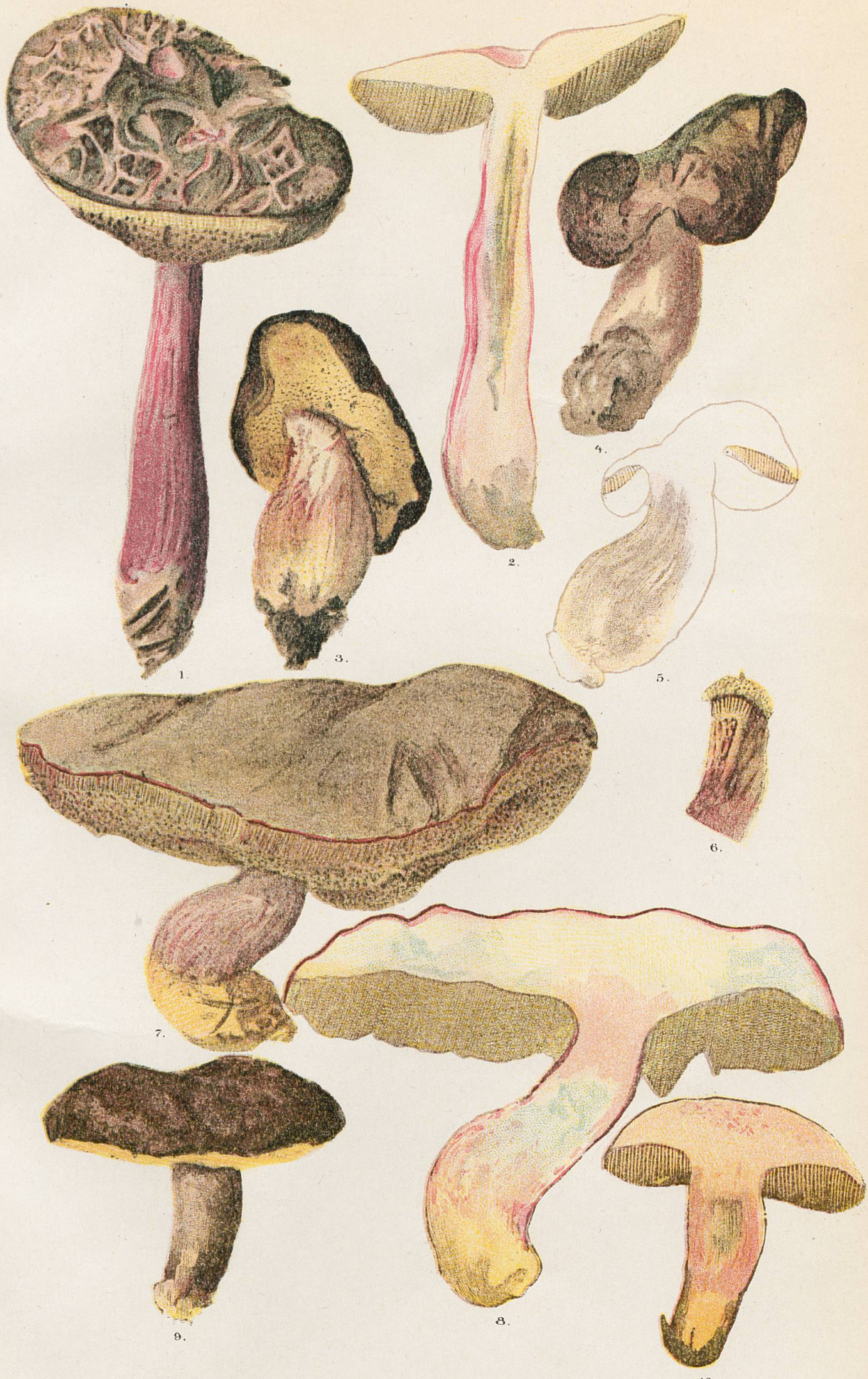
Formes de forêts de conifères.

1 et 2, Palezieux. - 3-6, Marécottes. - 7 et 8, Filons. - 9 et 10, Pointe de Targuillan.