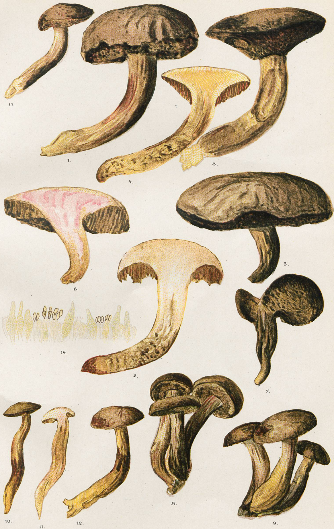
1 à 13, Sous-espèce subluridus . - 14, Marge de tube vue au microscope.