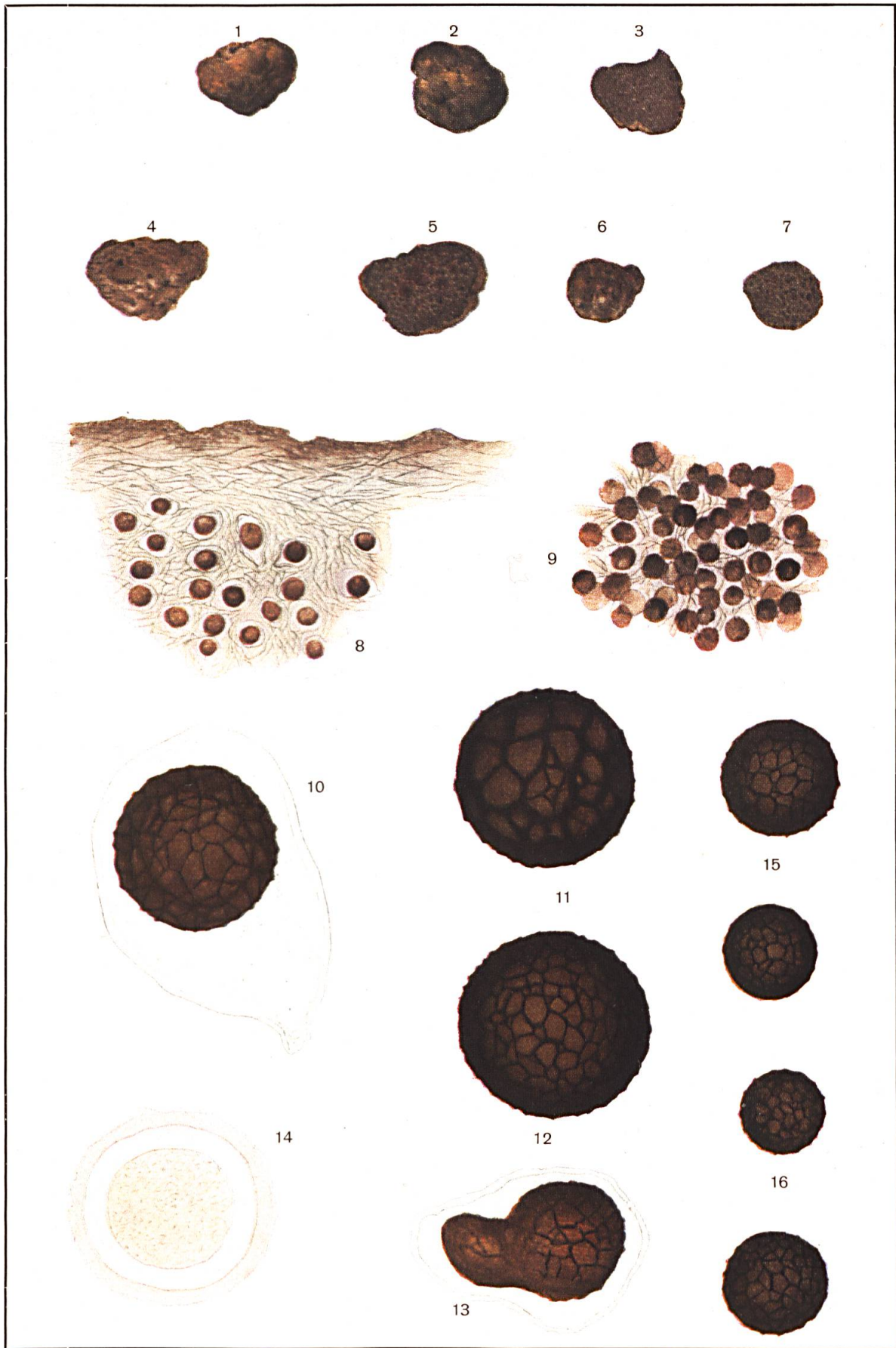
PARADOXA MONOSPORA Mattiolo (Nov. Genus)