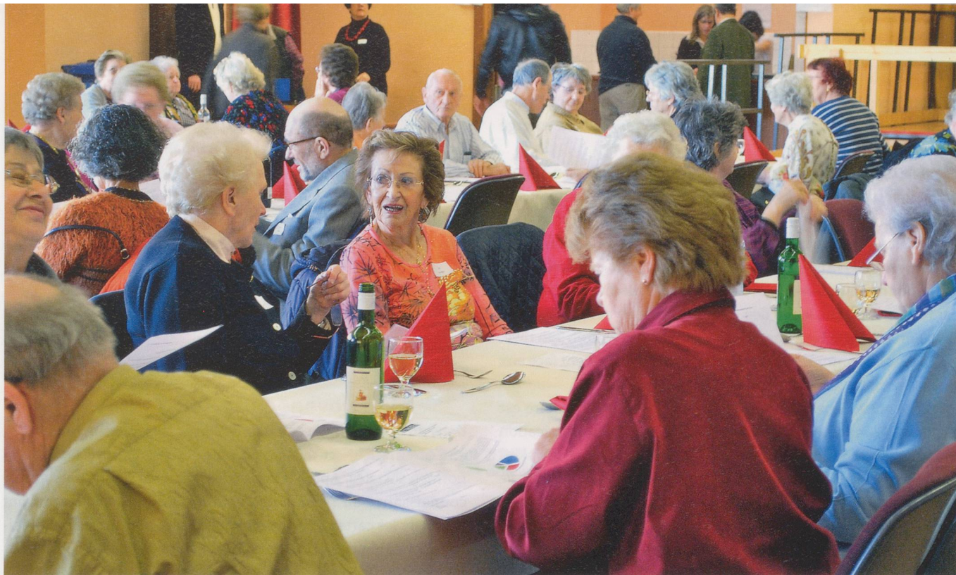
Quelque 130 personnes, habitants et professionnels du réseau médico-social, ont assisté au forum destiné à restituer le « diagnostic communautaire » réalisé dans leur quartier l'an dernier.