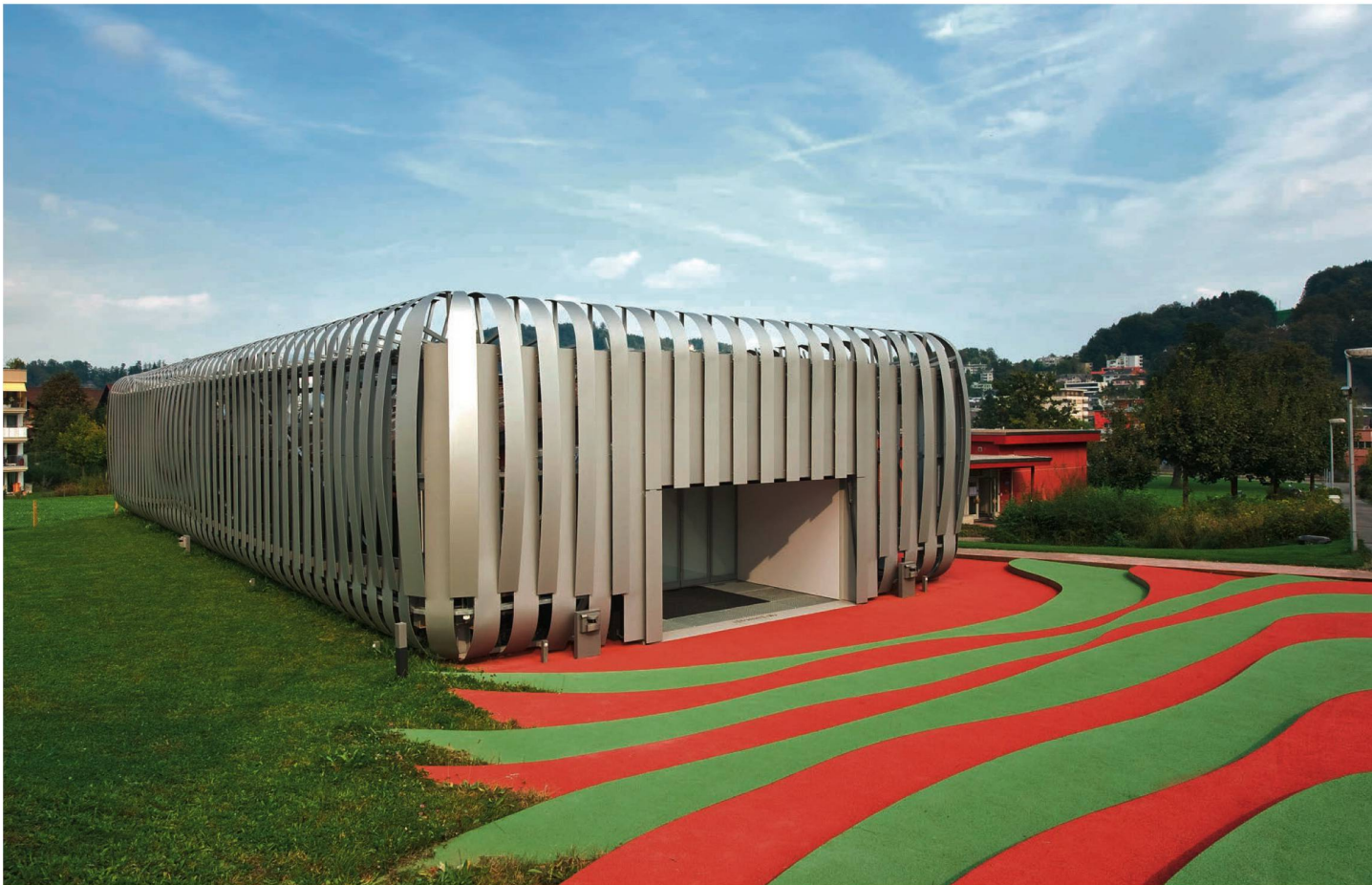
Le iHomeLab sur le campus de la Haute école de Lucerne, à Horw: le bâtiment avec ses lamelles argentées est unique.