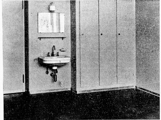
Abbildung 5 Aluminium-Fußleisten

Wenn die Hohlkehle aus irgendwelchen praktischen oder finanziellen Gründen nicht in Betracht kommen kann, so kann sie durch eine normale Aluminium-Fußleiste ersetzt werden. Diese 6 cm hohe Leiste mit kleiner Hohlkehle und Abschlußnasen stellt, wie Abb. 5 zeigt, ebenfalls einen sauberen, hygienischen und dekorativen Boden- und Wandabschluß dar, sodaß es nicht verwunderlich ist, daß diese Aluminium-Fußleisten schon zu Zehntausenden von Metern in Spitälern, Anstalten und Verwaltungsgebäuden usw. verlegt wurden.