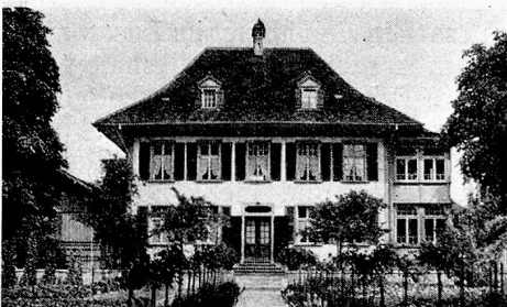
Das Erholungsheim Neuhaus