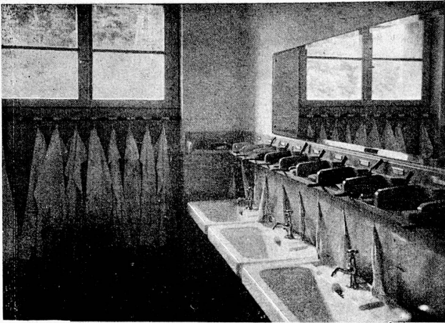
Oberes Bild: Waschraum