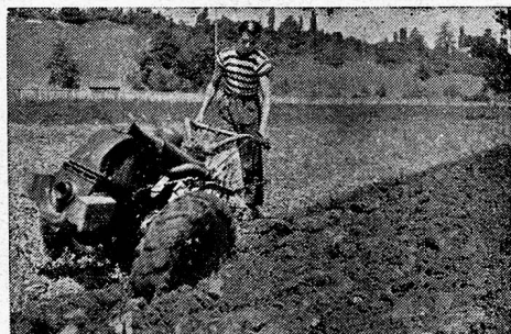
Typen 1944: 4, 8 und 10 PS.