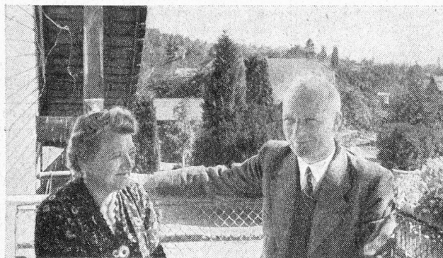
Siesta zweier Holländerfreunde in der Wäckerling- stiftung