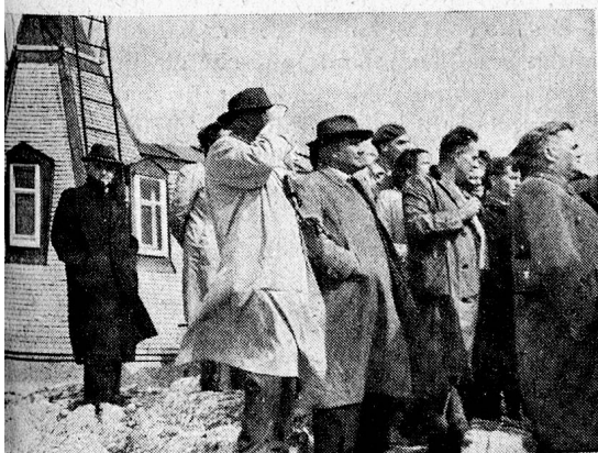
Geographiestunde auf dem Säntispfjel