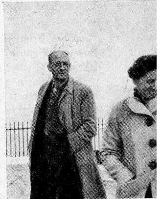
D. Q. R. und J. Mulock Hou Amersfoort. — Trotz Konzeptionslager ungebeugt