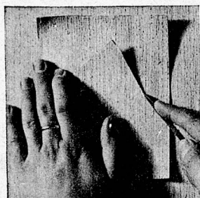
2. Flick ausschneiden