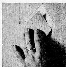
3. Flick einsetzen